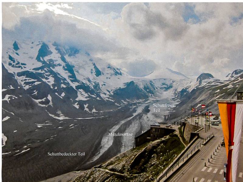
Abbildung 3: Die Pasterze weist im Sommer 2013 einen schuttbedeckten und schuttfreien Teil auf. Die Mittelmoräne zieht sich bis an die Gletscherstirn. Links im Bild die NE-Wand des Grossglockners (MATZKA, 2014)

Fotos von ZÄNGL UND HAMBERGER (2004) zeigen, dass die orographisch rechte Mittelmoräne im Jahr 1938 schon vorhanden war. In den folgenden Jahren ver-