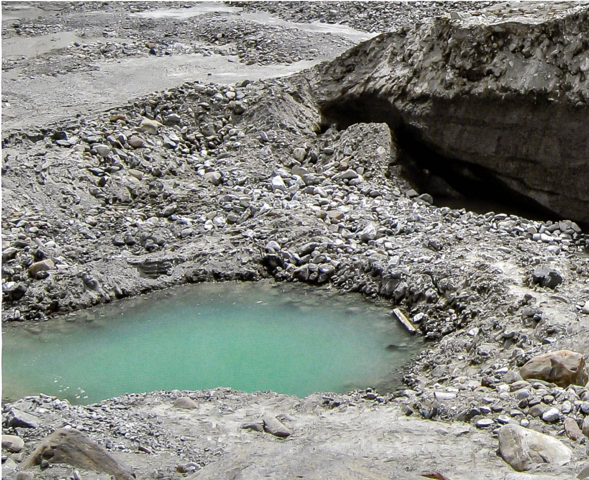
Abbildung 5: Toteisloch im Gletschervorfeld der Pasterze im Juli 2013. (MATZKA, 2014)

Ein weiteres Charakteristikum für Gletschervorfelder ist das Auftreten von Toteislöchern. Abb. 5 zeigt ein solches Toteisloch im Vorfeld der Pasterze.