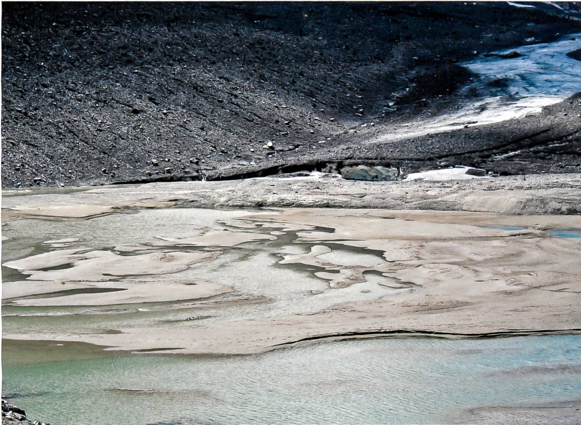
Abbildung 7: Schmelzwasser und flächenhaft verbreitetes Material im Gletschervorfeld der Pasterze im Juli 2013 (MATZKA, 2014).

ben, auf dem Untergrund aus und wird im unverdichteten Zustand leicht von Schmelzwässern abtransportiert.