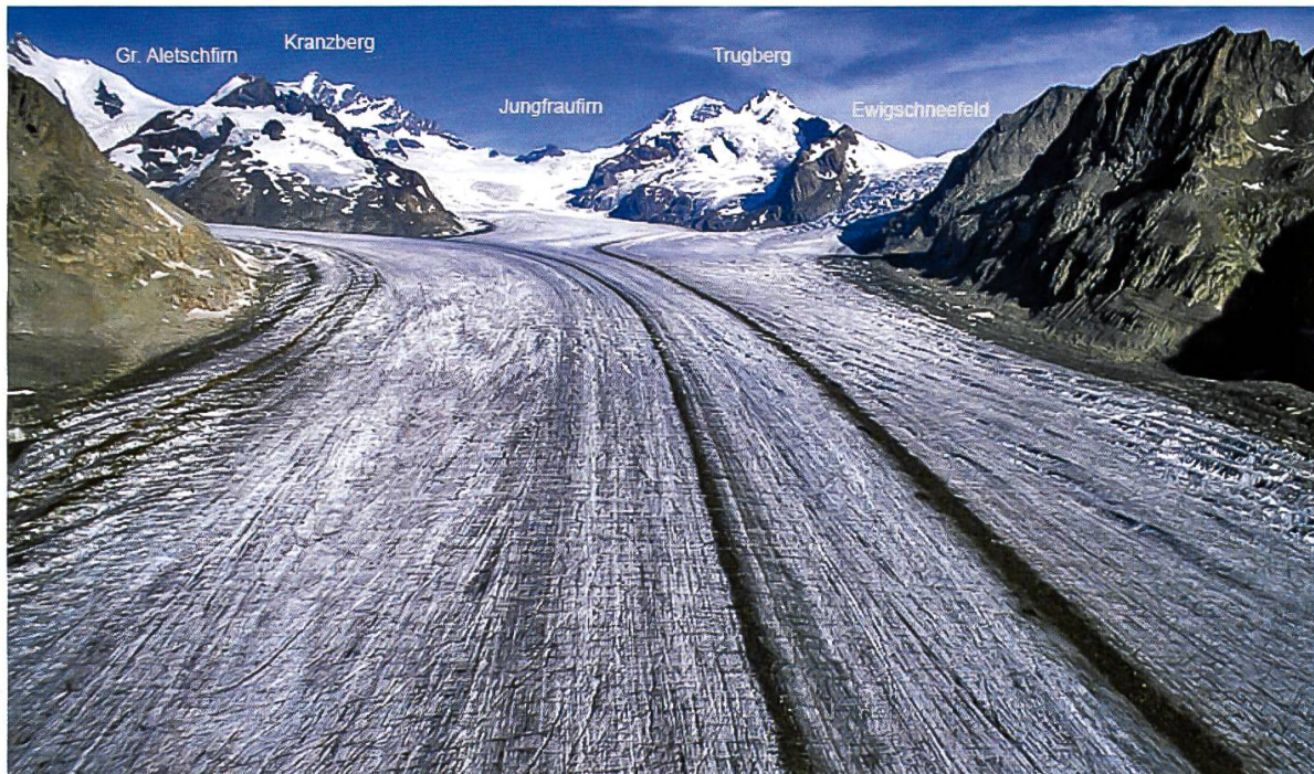
Abbildung 1: Zusammenfluss der Firnfelder des Grossen Aletschgletschers am Konkordiaplatz und die daraus resultierende Entstehung der beiden Mittelmoränen. Die Trugberg- und Kranzbergmoräne fließen als dunkle Schuttbänder, gut an der Eisoberfläche erkennbar, talabwärts.

Die orographisch rechte Moräne, die Kranzbergmoräne, bleibt bis zur Gletscherfront erhalten. Im Gegensatz dazu vereinigt sich die Trugbergmoräne mit der Seitenmoräne (BACHMANN, 1978).