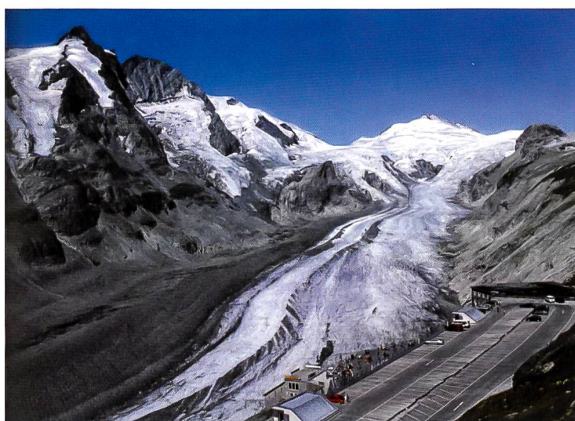
Abbildung 2: Die Pasterze im Jahr 1938 (oberes Bild) und 2003 (unteres Bild). Im Jahr 1938 ist die Fläche des schutfreien Eisteiles noch deutlich grösser als im Jahr 2003. Auch die Mittelmoräne ist im Jahr 1938 noch nicht zu erkennen und wird erst in den folgenden Jahren auf der Eisoberfläche sichtbar (ZÄNGL UND HAMBERGER, 2004).