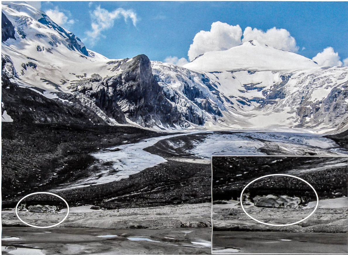
Abbildung 4: Das Foto zeigt die Gletscherfront im Sommer 2013. Gut erkennbar ist, dass der Schutt der Mittelmoräne auf der Eisoberfläche aufliegt (siehe Kreis) und sich im Eisinneren nicht Richtung Gletscherbasis fortsetzt. Die Mächtigkeit des Schuttes ist vergleichsweise gering und ermöglicht kein grosses Transportvolumen durch die Mittelmoräne. Gut erkennbar ist auch die deutlich höhere Eismächtigkeit im schuttbedeckten Teil des Gletschers. (MATZKA, 2014)

Diese Mittelmoräne ist also keine bis an die Eisbasis reichende Schuttakkumulation, sondern entspricht auch dem in der Literatur beschriebenen Eisrücken mit Schuttüberzug (GUDMUNDSSON ET AL., 1997; BAUDER, 2001; BENNETT UND GLASSER, 2009).