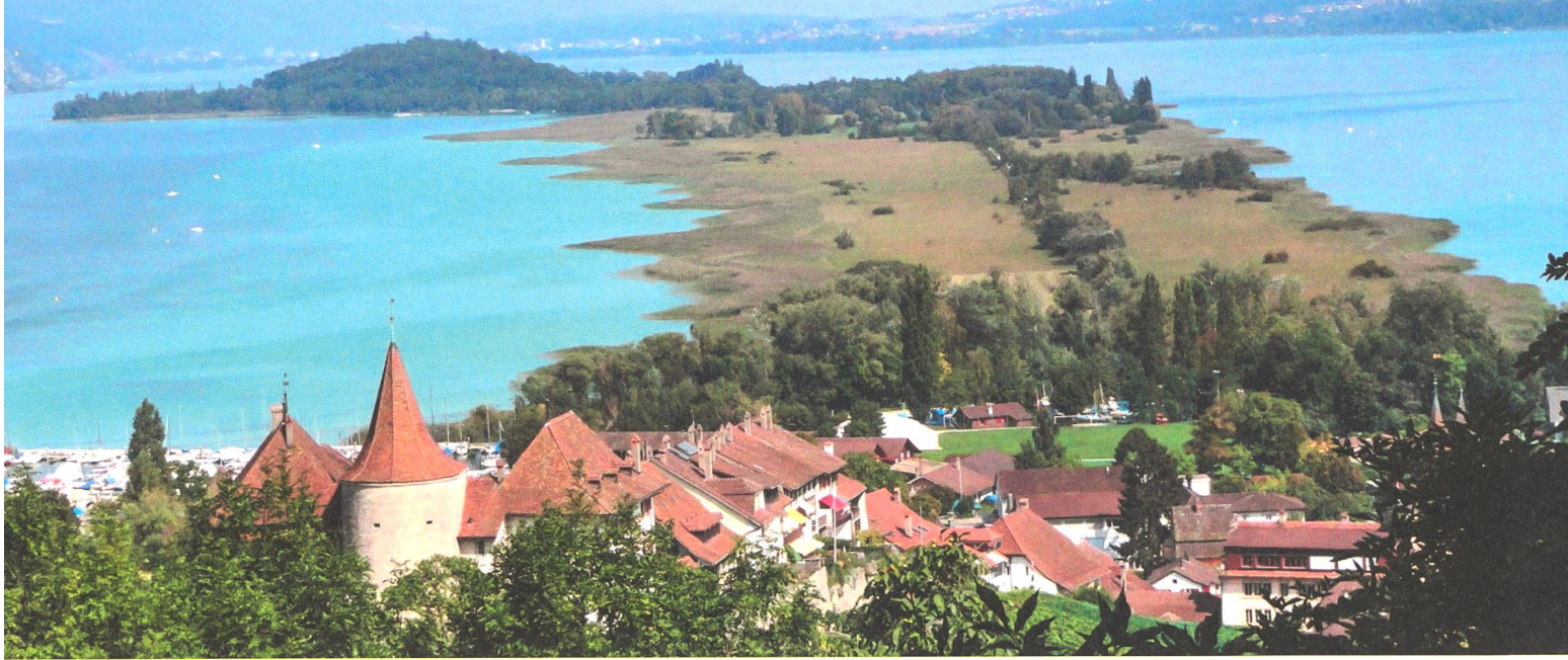
Blick von Erlach über den Heidenweg nach der St. Petersinsel (Foto: Christine Föhr).