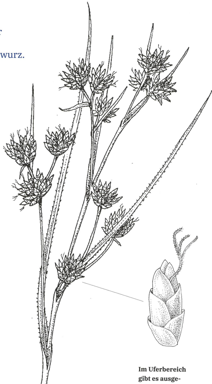
Im Uferbereich gibt es ausgedehnte Bestände mit Schneidbinse ( Cladium mariscus ) (Zeichnung: Stefan Eggenberg).

Bei der Chüngeliinsel trafen die Exkursionsteilnehmer auf Bruchwald mit den typischen Arten wie die Schwarzerle ( Alnus glutinosa ). Die «Insel» selbst war geprägt von einem Hartholzauenwald. Riesige Eschen ( Fraxinus excelsior ), Walnussbäume ( Juglans regia ), Berg-Ulmen ( Ulmus glabra ) und Waldföhren ( Pinus sylvestris ) bildeten ein dichtes Dach über niedrigeren Süskirschen ( Prunus avium ), Traubenkirschen ( Prunus padus ) und Grauerlen ( Alnus incana ) sowie typischen Waldpflanzen wie der