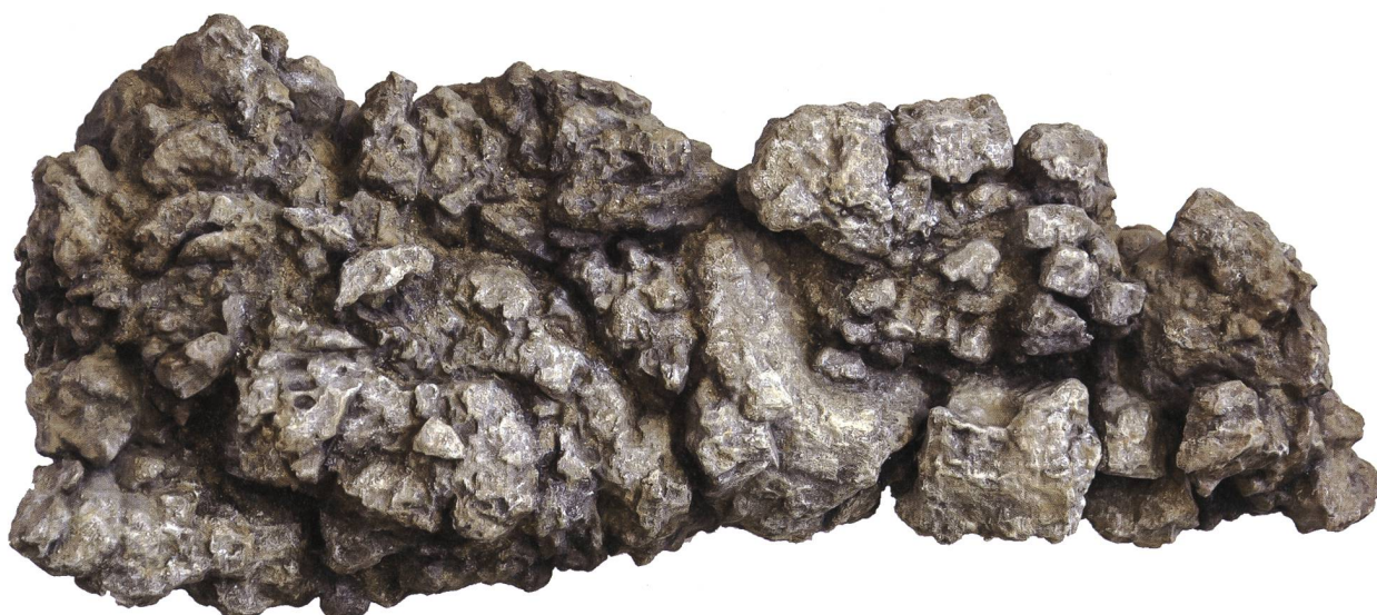
Abb. 2: Koproolith von T. rex (Abguss). Das Original wurde in Kanada gefunden und wird im Royal Saskatchewan Museum in Kanada aufbewahrt. Objektbreite 37 cm.

T. rex ist ein Immigrant (BRUSATTE & CARR 2016). Obwohl mehrere andere Vertreter der Tyrannosaurier in der späteren Kreidezeit den Westen der USA durchstreift hatten, waren sie keine Vorfahren von T. rex . Vielmehr waren asiatische Arten wie Tarbosaurus und Zhuchengtyrannus seine engsten Verwandten. Er begann seine Laufbahn in China oder in der Mongolei, zog über die Bering-Landbrücke, anschliessend durch Alaska und Kanada ins Innere des heutigen Amerika und breitete sich bis New Mexico und Texas aus. Dabei vertrieb er alle anderen mittelgrossen bis grossen Raubdinosaurier. T. rex existierte gerade mal 3 Millionen Jahre lang, vor 68 bis vor 66 Millionen Jahren am Ende der Kreidezeit. Erdgeschichtlich gesehen kurz, denn Dinosaurier traten erstmals vor 235 Millionen Jahren, die ersten Theropoden vor 228 Millionen Jahren auf. Die Überfamilie der Tyrannosauroida, zu der «Rex» zählt, tauchte vor 168 Millio-