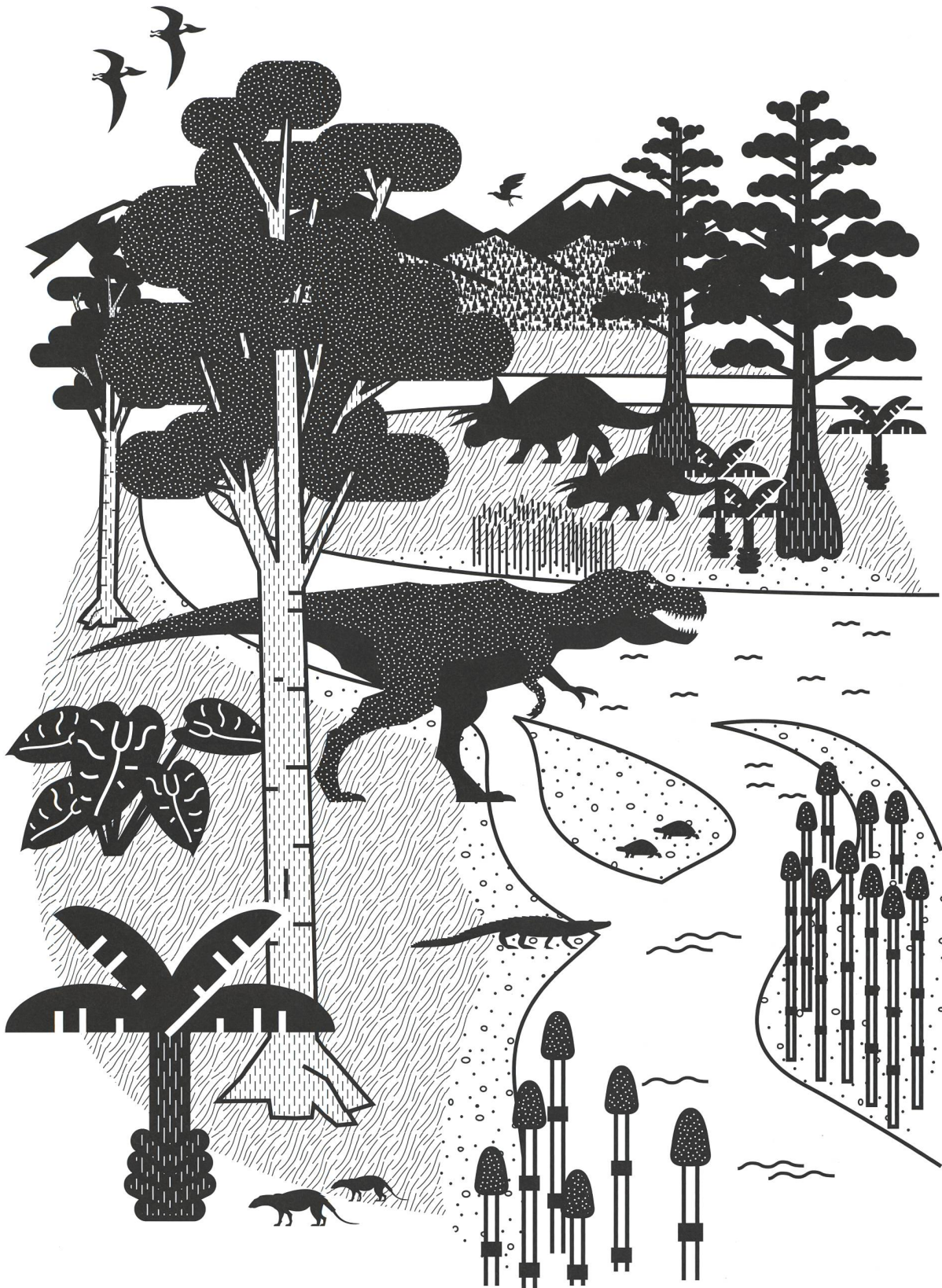
Abb. 1: Rekonstruktion des Lebensraumes von T. rex .