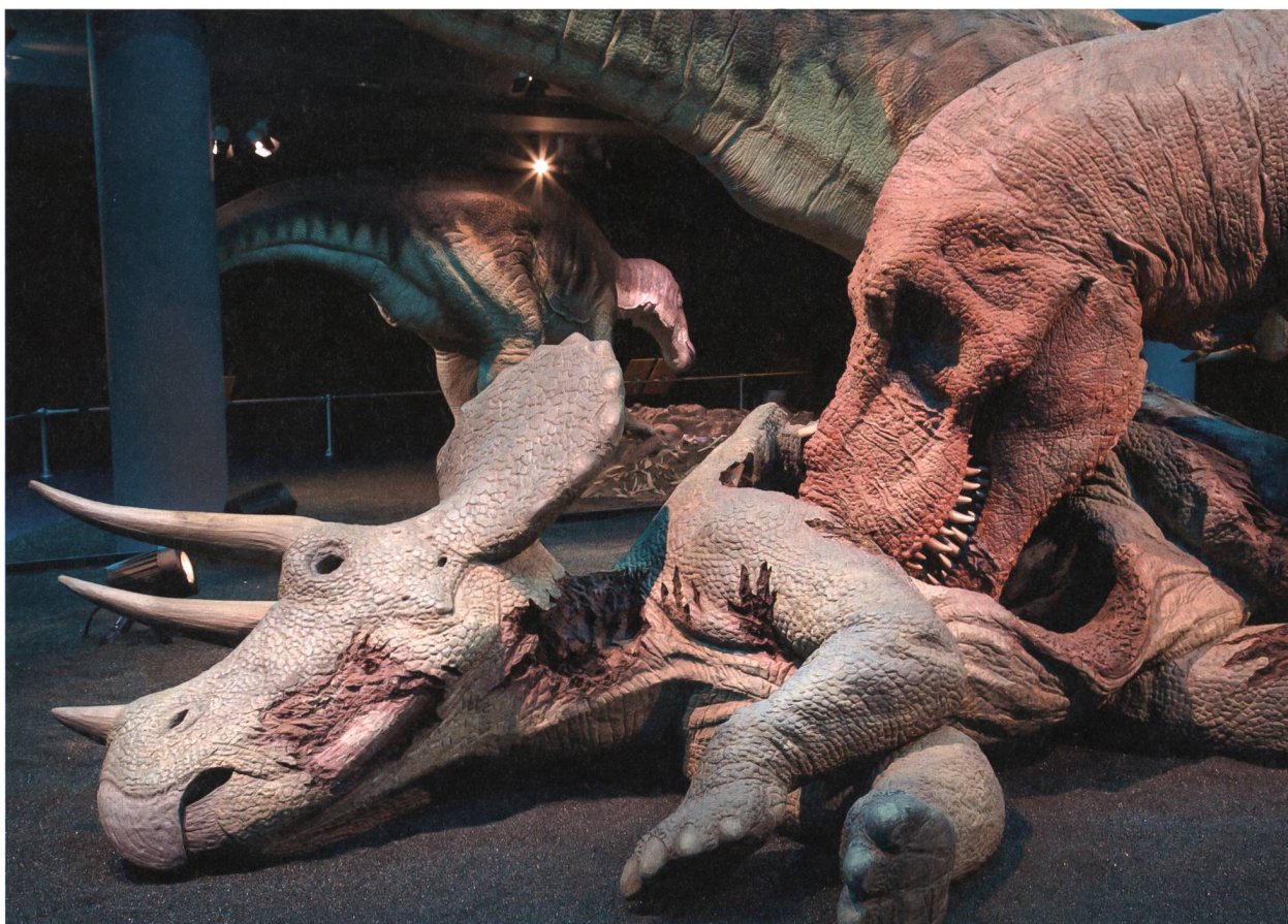
Abb. 6: T. rex tut sich an einem Triceratops -Kadaver gütlich.