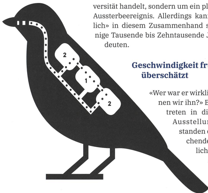
Abb. 4: Schematische Darstellung einer Vogellunge mit Luftsäcken.