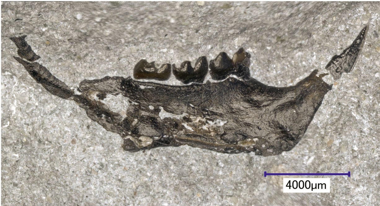
Abb. 9: Kieferast eines Wühlers, Fund 2020, auf dem Ausbruchsmaterial des Hirschenparktunnels durch ein Team des Naturhistorischen Museums.