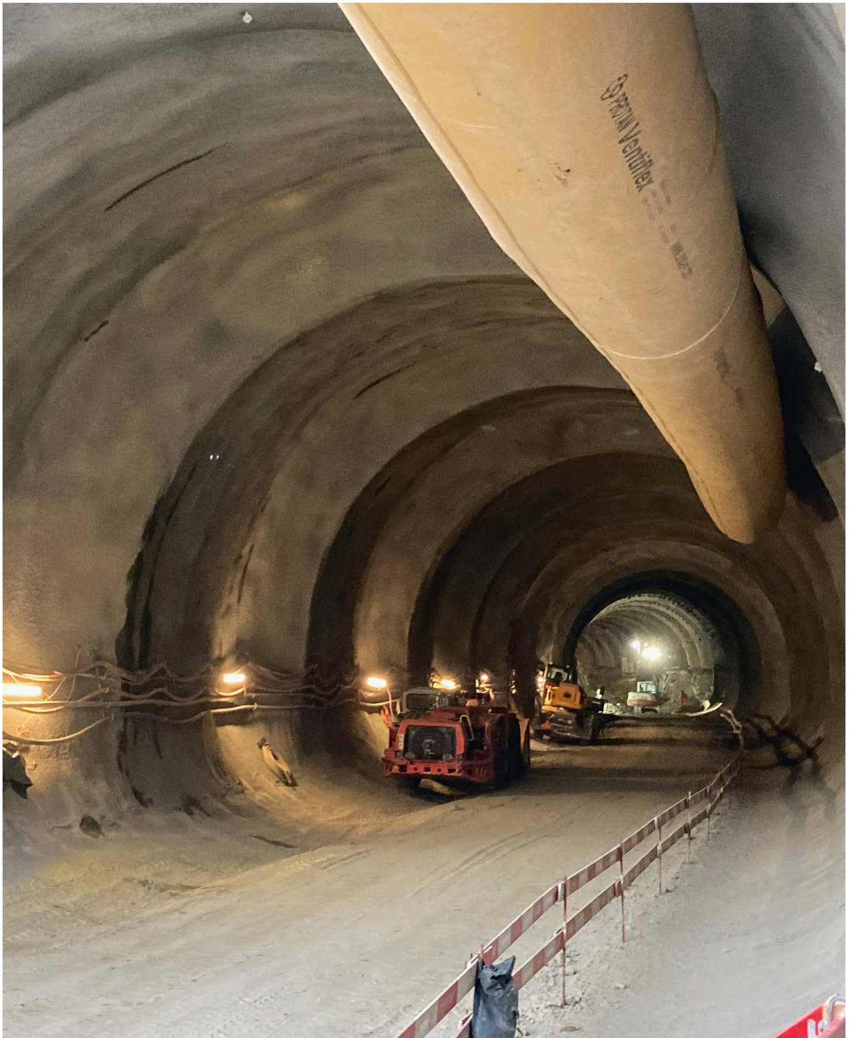
Abb. 2: Blick vom Hirschenpark Richtung Eilgut in den entstehenden RBS-Tunnel. Oben ist die halbkreisförmige Kalotte zu erkennen, die gut gesichert ist. Unten wird die Sohle in einer zweiten Bauphase nochmals 3 bis 4 m abgeteuft.