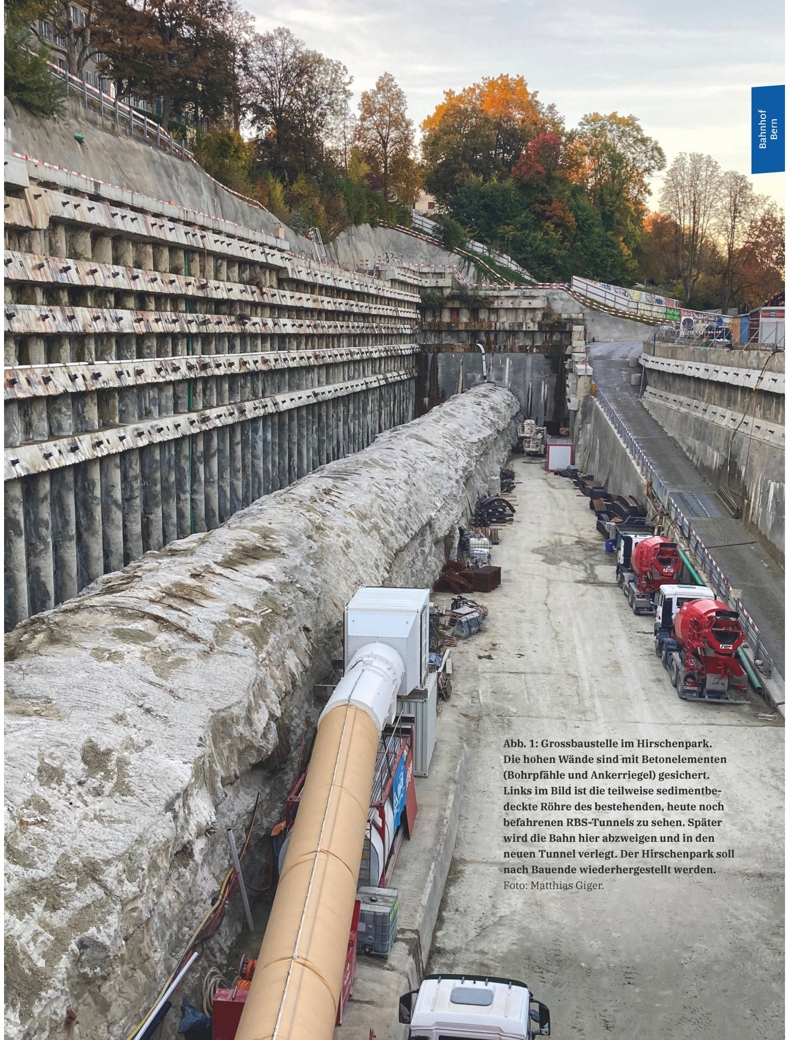
Abb. 1: Grossbaustelle im Hirschenpark. Die hohen Wände sind mit Betonelementen (Bohrpfähle und Ankerriegel) gesichert. Links im Bild ist die teilweise sedimentbedeckte Röhre des bestehenden, heute noch befahrenen RBS-Tunnels zu sehen. Später wird die Bahn hier abzweigen und in den neuen Tunnel verlegt. Der Hirschenpark soll nach Bauende wiederhergestellt werden.