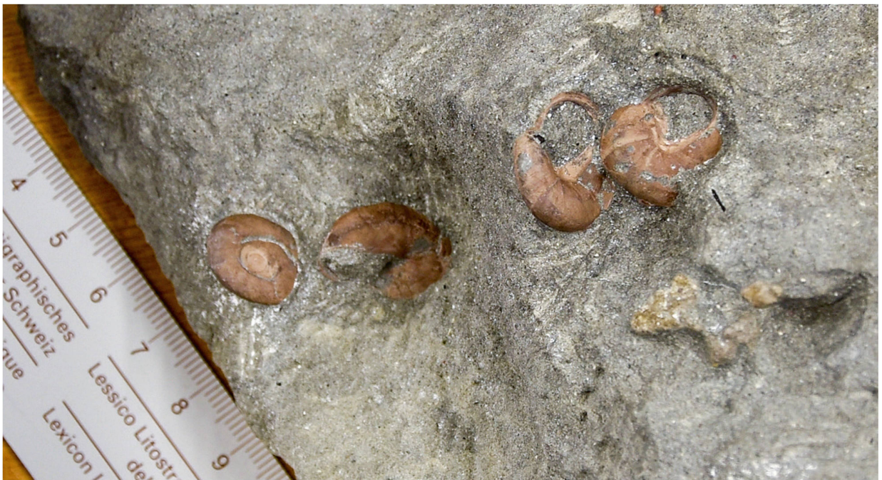
Abb. 8: Bänderschnecken, Fund 2020, auf dem Ausbruchsmaterial des Hirschenparktunnels durch ein Team des Naturhistorischen Museums.