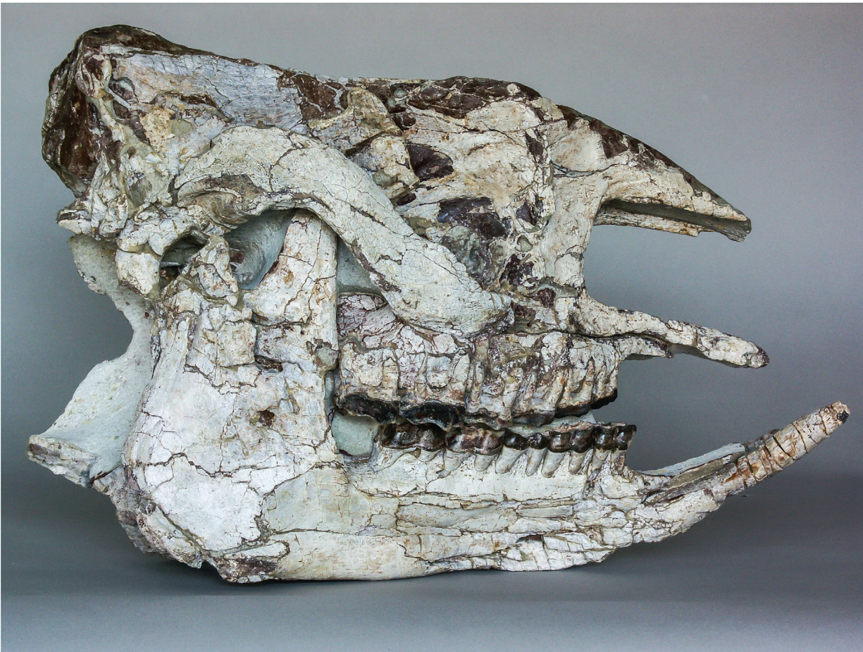
Abb. 7: Einziger vollständig erhaltener Schädel eines hornlosen Nashorns, Diaceratherium lemanense , gefunden 1850 beim Bau der Tiefenastrasse, in der Unteren Süsswassermolasse an der Engehalde in Bern.

Bildbreite: 55 cm.