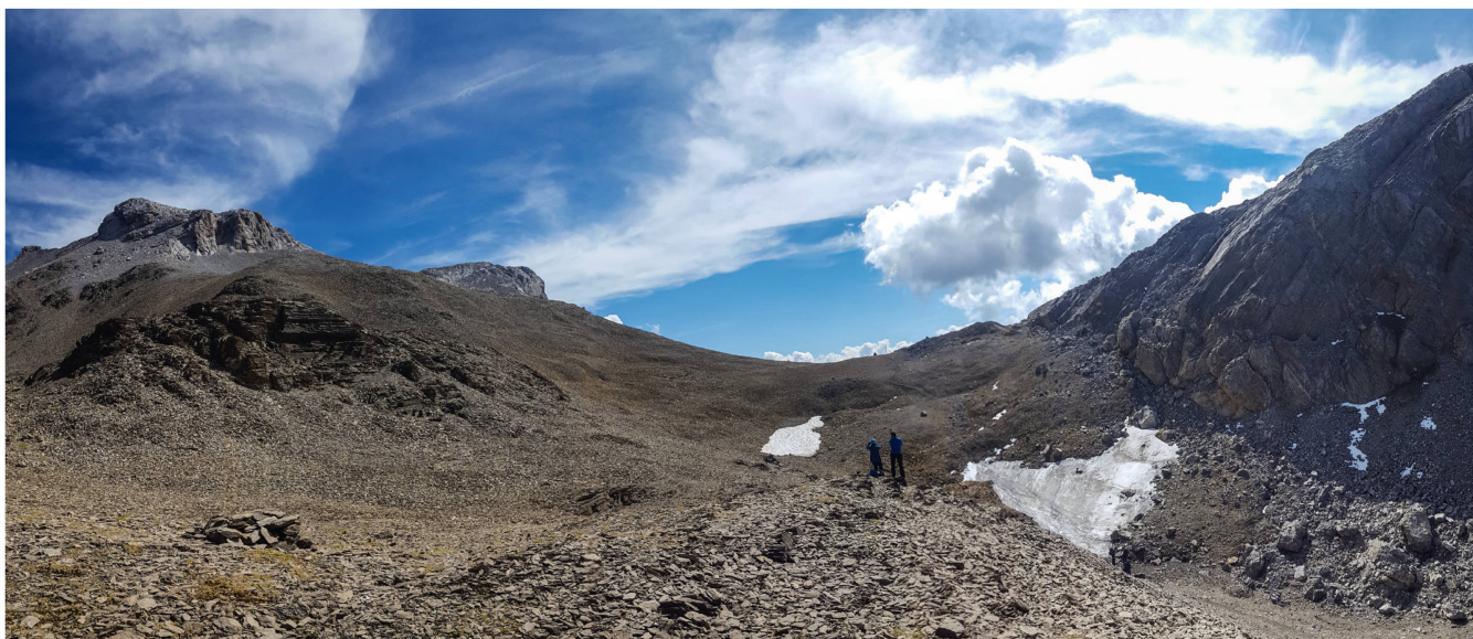
Abb. 3: Situation im Wildhorngebiet und am Schnidejoch (Passübergang links der Bildmitte). Die NE Flanke des Wildhorns (3250 m; rechts der Bildmitte) ist immer noch vergletschert. Archäologische Gegenstände wurden am Rande der zwei grösseren Eisflecken unterhalb der Schnidejochs gefunden (auffallend ist vor allem der grössere, dreieckige Eisfleck links unterhalb der Bildmitte). Panorama vom ADB (Archäologischer Dienst des Kantons Bern).

Eine weitere interessante Anwendung ist die Quellenzuordnung von Feinstaub und \text{CO}_2 . Fossile Brennstoffe enthalten kein messbares ^{14}\text{C} , erneuerbare Brennstoffe (z.B. Holz für Holzheizungen) liefern Verbrennungsprodukte mit höheren, modernen ^{14}\text{C} -Werten. Interessant ist auch der Vergleich von Messstationen. So sind die fossilen Beiträge auf dem Schauinsland (Schwarzwald) etwas höher als jene auf dem Jungfraujoch. Auch Methanquellen lassen sich so unterscheiden: Methan als rezentes Sumpfgas hat deutlich höhere ^{14}\text{C} -Gehalte als das (fossile) Erdgas aus geologischen Formationen.