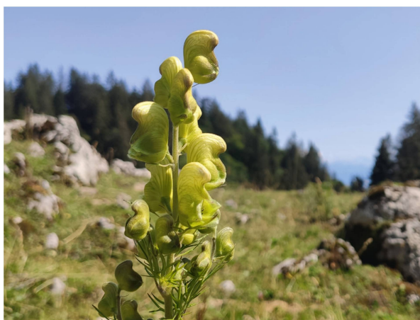
Gift-Eisenhut ( Aconitum anthora )

Frisch gestärkt machten wir uns dann auf den Abstieg und auf zum eigentlichen Kern der Exkursion. Etwas bange war dem Exkursionsleiter schon, denn was, wenn der Star des Tages noch nicht blühen sollte? Der kühle, verregnete Sommer 2021 konnte bei der Phänologie für die eine oder andere Überraschung sorgen. Doch kaum waren wir etwas in den Südosthängen der La Dôle, gab es zum einen grosse Erleichterung und bei anderen grosse Freude: der Gift-Eisenhut ( Aconitum anthora ) war in Vollblüte!