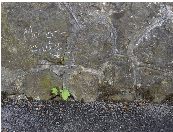
Die Mauerraute ( Asplenium ruta-muraria ) wächst schon in den kleinsten Mauerritzen

Der Weg führte die Pflanzenbeschrifter:innen weiter über den Donnerbühlweg, wo zahlreiche Mauerrauten ( Asplenium ruta-muraria ), Braunstieliger Streifenfarn ( Asplenium trichomanes ) und Gelber Lerchensporn ( Corydalis lutea ) die Mauern begrüneten. Ein (zu) gross gewachsener