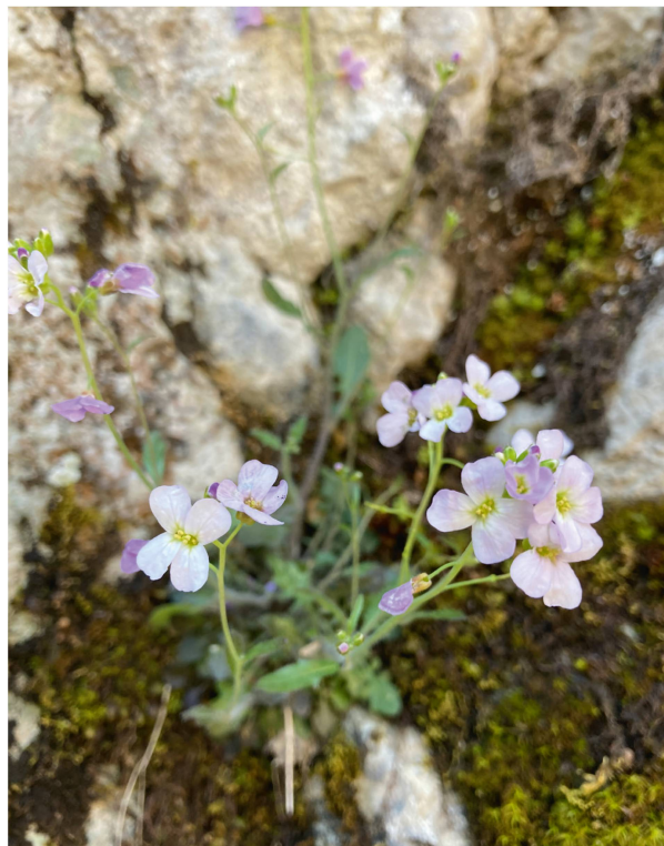
Sand-Schaumkresse ( Cardaminopsis arenosa ).