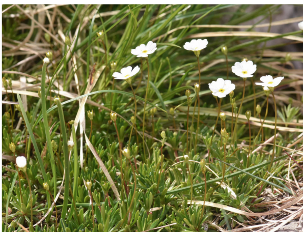
Milchweisser Mannsschild ( Androsace lactea ).

Highlights wie der Milchweisse Mannsschild ( Androsace lactea ), das Grossblütige Sandkraut ( Arenaria grandiflora ) oder Alpelemente wie das Narzissenblütige Windröschen ( Anemone narcissiflora ) zu finden sind. Zudem erfuhren wir, welche Alpelemente auf dem Gipfel natürlicherweise vorkommen und welche Arten von teils eher fragwürdigen Ansiedlungen der Vergangenheit stammen. Auch Gefährdung und mögliche Massnahmen zur Förderung der Pflanzen auf dem Chasseral wurden thematisiert. Erstaunlich war die unterschiedliche Artzusammensetzung innerhalb von wenigen Metern auf dem Grat zu beobachten. Je nachdem ob man sich auf der schattigen Nordseite oder auf der sonnigen Südseite befand, fanden sich aufgrund der unterschiedlichen Exposition und der damit verbundenen klimatischen Bedingungen sehr verschiedene Lebensräume und Arten.