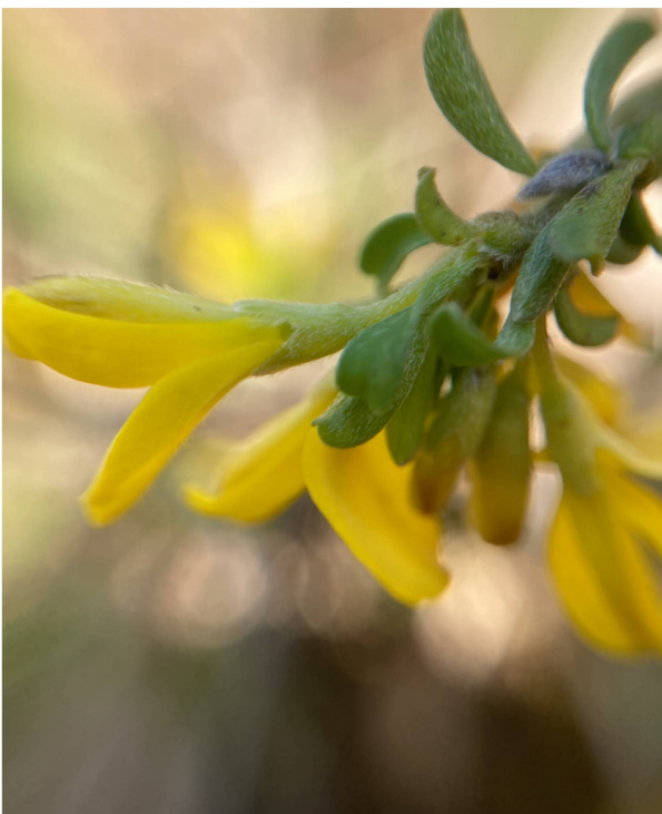
Beharter Ginster ( Genista pilosa ).

Genf vor. Beides sind kalkreiche Gebiete, was zeigt, dass auch bei kalkreichem Untergrund der Standort zumindest kleinflächig sauer sein kann.