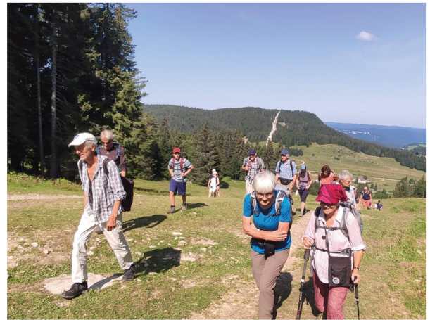
Die wackere Gruppe beim Aufstieg zur La Dôle.

Trotz der weiten Anreise (sprich dem frühen Start) und der Androhung einer sportlichen Höchstleistung hat sich am Morgen des 21. August 2021 ein beachtliches Grüppchen von BBGler:innen an der Bahnstation