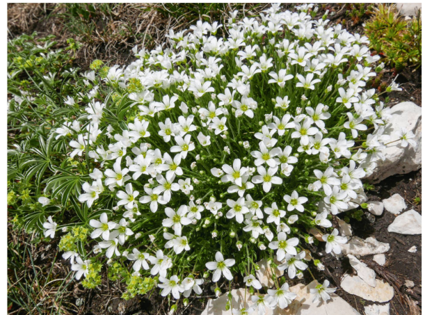
Grossblütiges Sandkraut ( Arenaria grandiflora ).

Nebst dem «klassischen Exkursionsteil» konnten die Teilnehmenden an dieser Exkursion aktiv mitwirken. Gemeinsam kartierten wir mehrere Teilpopulationen des Grossblütigen Sandkrautes ( Arenaria grandiflora ) entlang dem langgezogenen Gipfelgrat vom Hotel zum Turm. Diese Population wird im Rahmen des Projekts «Flora Patenschaften» seit Jahren regelmässig kartiert. Ziel des Projektes ist es, solche seltenen und gefährdeten Arten mit Kartierungen durch Ehrenamtliche kontinuierlich zu überwachen. So können negative Entwicklungstrends und äussere Eingriffe frühzeitig erkannt und entsprechende Schutzmassnahmen ergriffen werden. Wir waren erfreut, dieses Jahr einige gut entwickelte Polster der Art zu finden und sind gespannt, welche Erkenntnisse wir aus künftigen Kartierungen ziehen können.