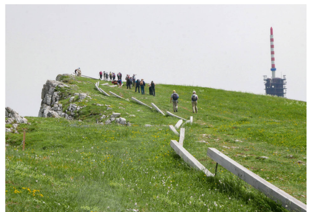
Zum Schutz der trittempfindlichen Gipflora wurden Holzabsperren erstellt.

Nach den Entdeckungen der Gipflora wurde es abenteuerlich. Auf der Suche nach weiteren typischen