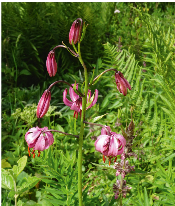
Trükenbund ( Lilium martagon ).

Anwachsen der Pflanzen erleichtern. Vermehrungseinrichtungen für Pflanzen haben wir im Garten keine, ausser für diejenigen, die sich leicht vegetativ vermehren lassen und so direkt in Töpfe zur Bewurzelung eingepflanzt werden, wie z.B. die Grenobler Nelke ( Dianthus gratianopolitanus ), das Gemeine Sommerröschen ( Helianthemum nummularium ) und der Schlangen-Knöterich ( Polygonum bistorta ).