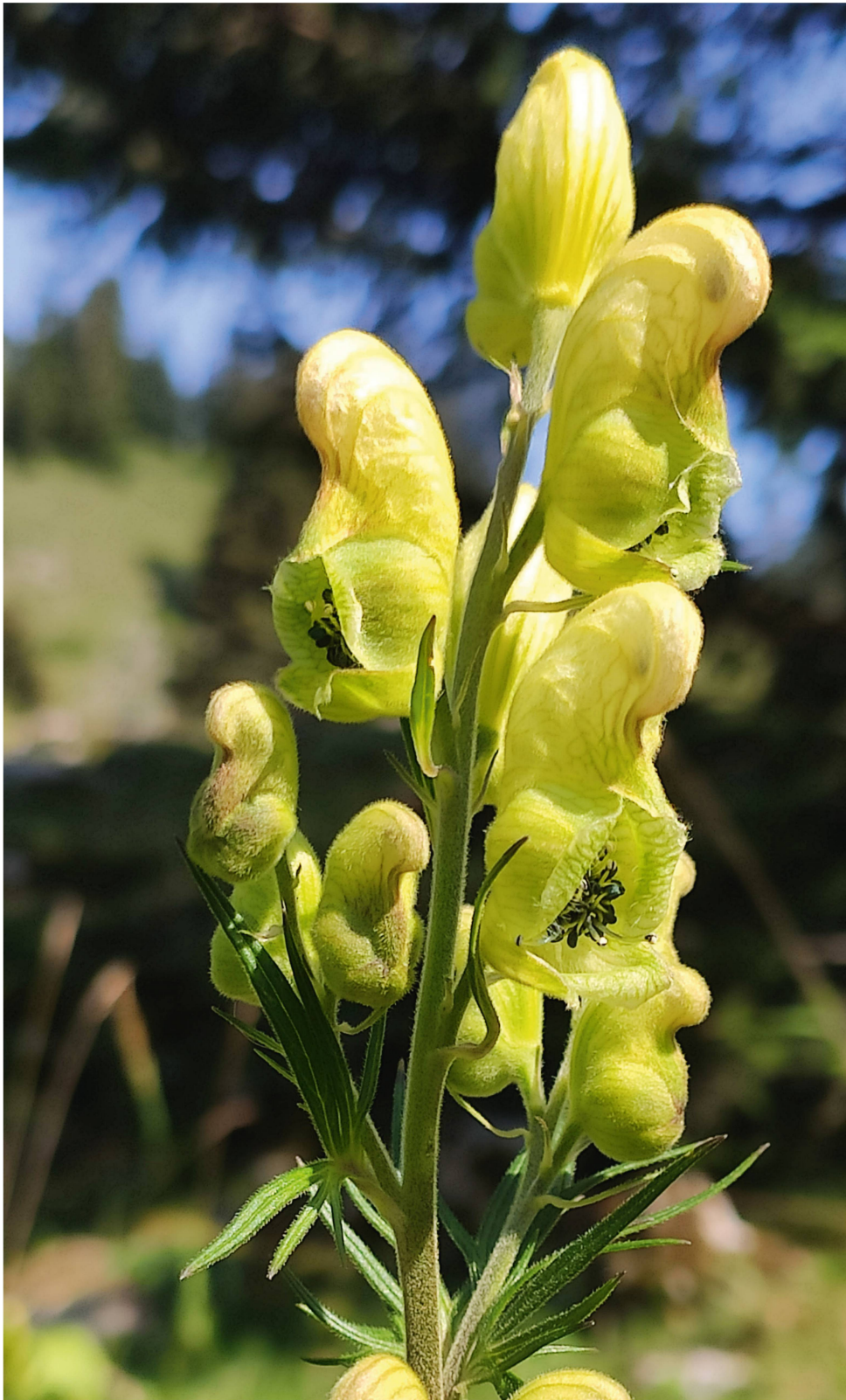
Der Star des Tages: Gift-Eisenhut ( Aconitum anthora ) – die schmalen Blattabschnitte und die grünlichgelbe Färbung sind typisch für diese seltene Art.