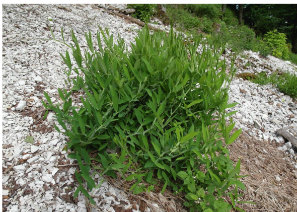
Verschiedenblättrige Platterbse ( Lathyrus heterophyllus ) in der Kalkschutthalde bei der Pfiffenrütiflue.

Leider verhinderte der jetzt langsam einsetzende Regen die noch vorgesehene Route bis zum Burghorn (Kantonsgrenze zum Aargau), wo noch einige weitere Arten gezeigt werden sollten. So stiegen wir durch den Buchenwald direkt nach Otelfingen ab, wo die Exkursion offiziell beendet wurde. Fazit: Obwohl wir die Gratfelsen ob Wettingen und Baden mit den speziellen Arten des Westgrates wie dem Berg-Täschelkraut ( Thlaspi montanum ), dem Lorbeer-Seidelbast ( Daphne laureola ) oder der Flaum-Eiche ( Quercus pubescens ) leider weglassen mussten, ist die Exkursion wohl dennoch gut gelungen.