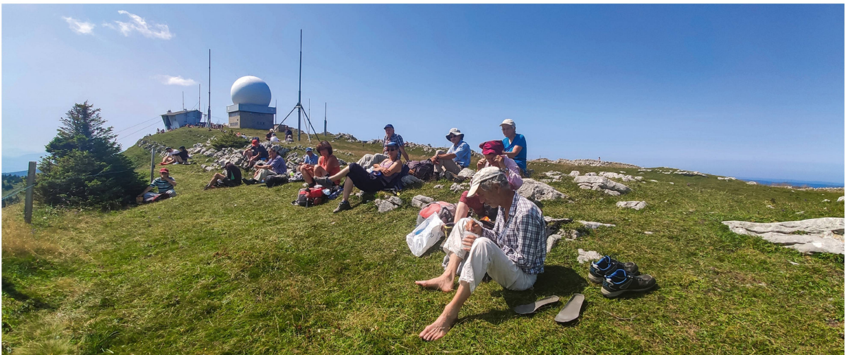
Verdienter Mittagsrast nach dem Aufstieg: die Gruppe bei der Messstation auf der La Dôle.

wie zum Beispiel der Zottige Mannsschild ( Androsace villosa ), der in der Schweiz nur gerade hier vorkommt. Auch das Graufilzige Sonnenröschen ( Helianthemum canum ) kommt in der Schweiz nur an wenigen Stellen im Jura vor – wir konnten ein paar schöne Exemplare dieser Art im Gipfelbereich finden. Besondere Hingucker waren auch die Feinblättrige Miere ( Minuartia capillacea ) oder Richers Johanniskraut ( Hypericum richeri ), welche wir beide noch blühend finden konnten – der regenreiche Sommer 2021 hatte doch auch seine guten Seiten! Unweit von unserem Picknickplatz blühte auch das Ysopblättrige Gliederkraut ( Sideritis hyssopifolia ) – manch ein:e Teilnehmer:in riskierte Kopf und Kragen, um ein besonders hübsches Bild zu machen.