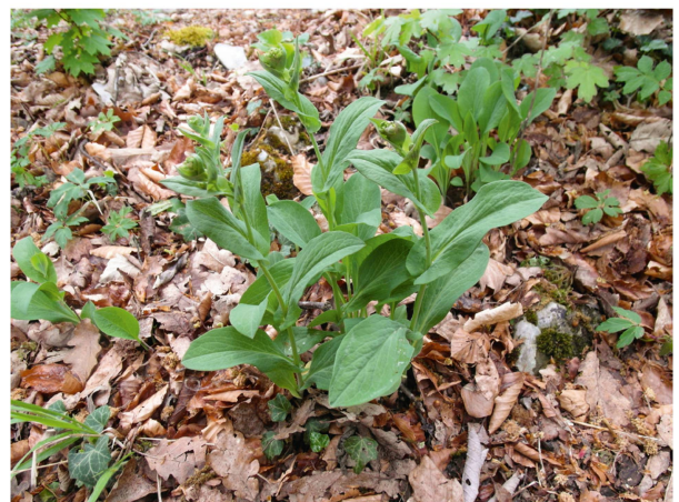
Eine der Charakterarten der Lägern ist das dort häufige Langblättrige Hasenohr ( Bupleurum longifolium ).