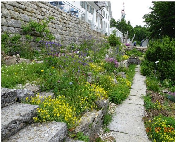
Seit 1977 ist der Juragarten vom Regierungsrat als schützenswertes Naturobjekt deklariert.