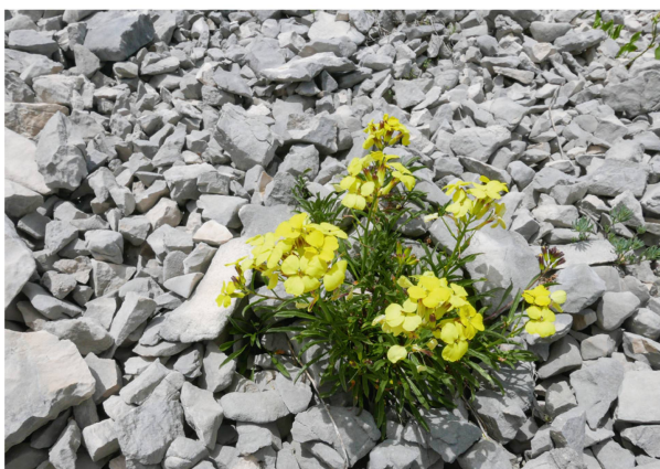
Das Jura-Leinkraut ( Linaria alpina subsp. petraea ) und der Blassgelbe Schöterich ( Erysimum ochroleucum ) innerhalb der Geröllfelder unter dem Gipfel des Chasserals.

Spezialitäten des Chasserals wagten wir uns in die Schotterfelder unterhalb des Gipfels. Obschon das Gelände nicht für alle Teilnehmer:innen einfach war, wurden wir reich belohnt: Inmitten von losem, grauem Gestein fanden sich botanische Farbtupfer und wir konnten die typischen Schotterpflanzen in voller Blüte bestaunen. Hier fanden wir das Jura-Leinkraut ( Linaria alpina subsp. Petraea ), den Blassgelben Schöterich ( Erysimum ochroleucum ) oder eine spezielle Form von Godets Witwenblume ( Knautia godetii ). Unterwegs zurück zum Gipfel fanden wir gar noch die Holunder Orchis ( Dactylorhiza sambucina ), welche am Chasseral fast die östlichsten Juravorkommen aufweist. Als Abschluss der Exkursion reichte es nach einem kurzen Aufstieg zurück auf den Gipfel sogar noch für ein gemeinsames Getränk mit guter Aussicht.