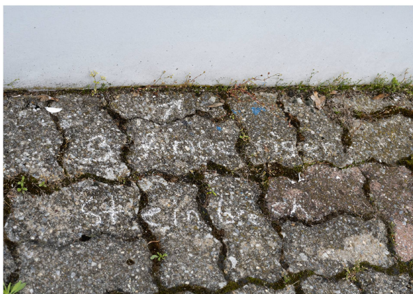
Dreifingeriger Steinbrech ( Saxifraga tridactylites ) beim Uni-Hauptgebäude in Bern.

dern auf, die Pflanzenvielfalt in der Stadt Bern zu entdecken und mit Kreide zu beschriften. Die beschrifteten Pflanzen sollten die Passant:innen neugierig machen und aufzeigen, wie viele verschiedene Pflanzen in Pflasterritten, an Strassenrändern und an Mauern gedeihen.