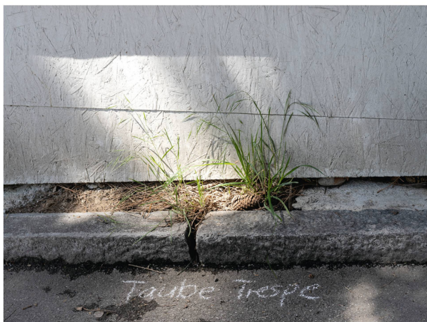
Die Taube Trespe ( Bromus sterilis ), eine von vielen Ruderalarten neben der Baustellenabspernung.

Am 22. Mai 2021 machte sich bei strahlendem Sonnenschein eine kleine aber feine Gruppe von BBG-Mitglie-