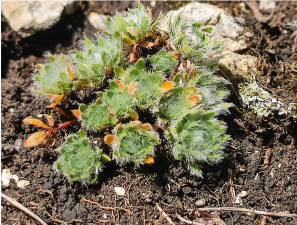
Der Zottige Mannsschild ( Androsace villosa ) ist auch ohne Blüte hübsch anzuschauen.