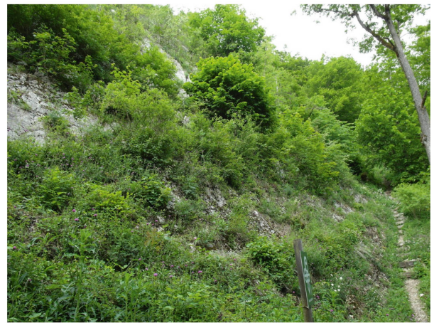
Das Highlight der Exkursion waren die steil gestellten Kalkschichten der Pfiffenrütiflue mit mehreren floristischen Besonderheiten.

Platterbse ( Lathyrus linifolius ) und der Wimper-Segge ( Carex pilosa ) sowie den sonst erwähnenswerten Arten Gold-Hahnenfuss ( Ranunculus auricomus aggr. ) und Heckenwicke ( Vicia dumetorum ). Bei bedecktem Wetter erreichten wir die Hochwacht, wo es eine kurze Kaffeepause im Restaurant gab. Danach kamen wir zu den Gratfelsen im Bereich der Burgruine Alt Lägern, ein klassischer Standort der Zürcher Botaniker, wo wir unter anderem auf die Alpen-Gänsekresse ( Arabis alpina ), den Trauben-Steinbrech ( Saxifraga paniculata ) und die Alpen-Johannisbeere ( Ribes alpinum ) trafen. Innerhalb der Ruine selbst blühten unter anderen das Frühlings-Fingerkraut ( Potentilla verna ) und die seltene Art Grosser Ehrenpreis ( Veronica teucrium ). Auf dem schmalen Gratweglein erblickten wir bald Arten wie das Wunder-Veilchen ( Viola mirabilis ), den Echten Salomonssiegel ( Polygonatum odoratum ) oder