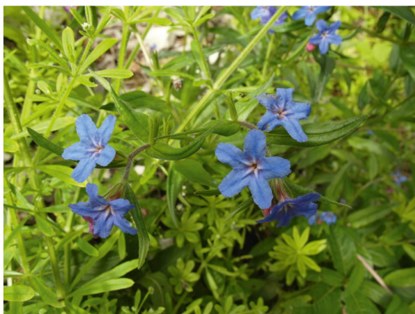
Der Blaue Steinsame ( Buglossoides purpureocaerulea ) an seinem einzigen bekannten Wuchsort auf der Lägern, der Pfiffenrütiflue.