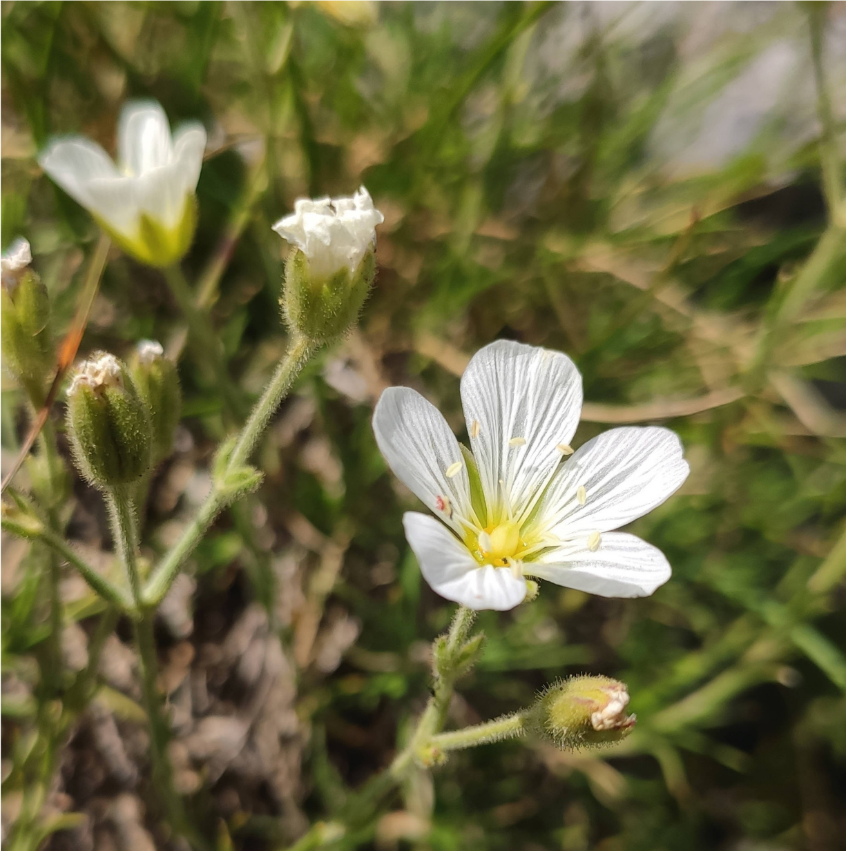
Eine Art, welche in der Schweiz nur an wenigen Stellen im Jura und Tessin gefunden werden kann: Feinblättrige Miere ( Minuartia capillacea ).

der La Dôle, doch botanische Cracks bestimmen zum Beispiel die verschiedenen Doldenblütler ohnehin lieber vegetativ. Eine besondere Herausforderung waren feingeschnittene dunkelgrüne Blätter, die beim Zerreiben unangenehm riechen (auch wenn die Beschreibung des Geruchs einer alten, leicht ranzigen Paella-Pfanne nicht für alle gleich nachvollziehbar war...). Des Rätsels Lösung war der Faserschirm ( Trinia glauca ) eine Art, die