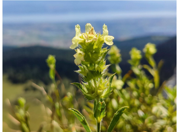
Im Gipfelbereich blühte das Ysopblättrige Gliederkraut ( Sideritis hyssopifolia ) prächtig.

in der Schweiz nur an wenigen Stellen vorkommt, auf der La Dôle aber in mehreren grossen Populationen zu finden ist.