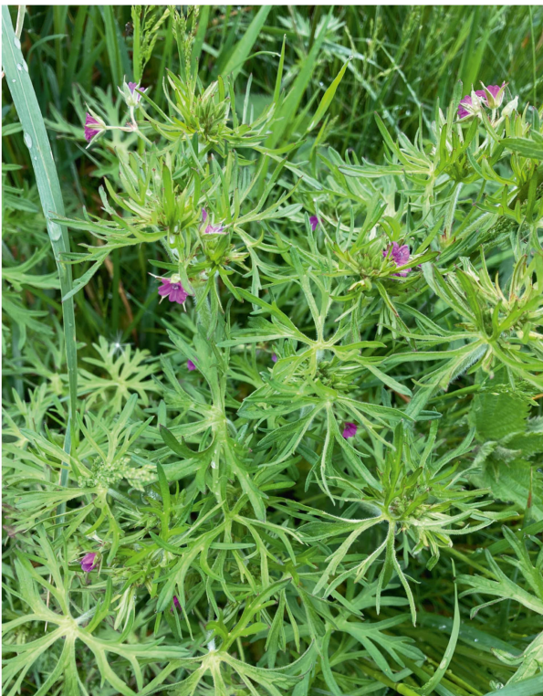
Schlitzblättriger Storchenschnabel ( Geranium dissectum ).