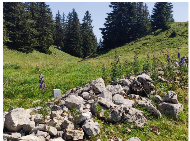
An Steinmauern Waldrändern und auf Lagerstellen blüht im Jura oft der Dichtblütiger Blau-Eisenhut ( Aconitum napellus subsp. vulgare ).

Natürlich konnten auch hier und dort noch ein paar Spätblüher bestaunt werden und sogar ein herrlich blühender Dichtblütiger Blau-Eisenhut ( Aconitum napellus subsp. vulgare ) diente als Vorwand, um eine kleine Verschnaufpause einzulegen. Schliesslich sollte ja die Gattung Aconitum an diesem Exkursionstag ganz im