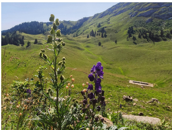
Die Route der BBG Exkursion zum Gift-Eisenhut.