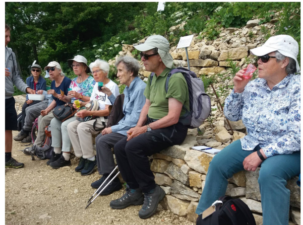
Interessante Erzählungen lassen sich prima mit einem Apéro kombinieren (Foto Felix Winkenbach).

die letzten 11 000 Jahre des südwestlichen Jura näher. Der Jura ist und bleibt entwicklungsgeschichtlich interessant, das wird sich in Zukunft mit dem Klimawandel noch vermehrt zeigen. Bequem auf der Kalksteinmauer am Hauptweg sitzend, hätten wir noch lange weiter zuhören und diskutieren können, auch das schöne Sommerwetter und die prächtige Aussicht über das Mittelland und Seeland bis weit in die schneebedeckten Alpen lud zum Verweilen ein. So langsam machte sich aber der Hunger bemerkbar und das obligate Apéro läutete die Mittagspause ein. Nach der individuellen Mittagsverpflegung trafen wir uns gestärkt wieder im Garten, um mit einer allgemeinen Einführung zur Gartenentstehung, der Gartenpflege und der Arbeitsorganisation das Nachmittagsprogramm zu starten. Die gemeinsame botanische Entdeckungstour endete ca. um 15 Uhr, so blieb noch Zeit für individuelle Touren und Entdeckungen durch den Garten, bevor es mit der Gondelbahn schwebend den Berg hinunterging.