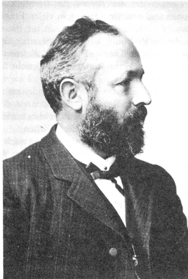
Georg Cantor (1845–1918)