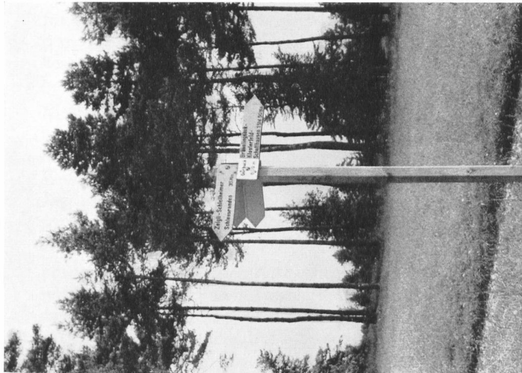
Die Wald- und Flurlandschaft des Randens bietet ausgezeichnete Gelegenheit zum Wandern und zur Erholung. Wanderwegweiser beim Gutbuck, Gemeinde Hemmental