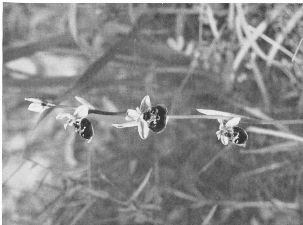
In den verhältnismäßig extensiv genutzten Gebieten des Randens findet sich eine charakteristische Flora mit verschiedenen seltenen, wildwachsenden Pflanzen. Hummelorchis ( Ophrys fuciflora ) im Dostental, Gemeinde Merishausen