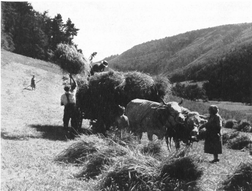
Die starke Grundstückzersplitterung, die vielfach ungünstigen topographischen Verhältnisse und die kargen Randenböden erschweren eine rationelle landwirtschaftliche Nutzung. Gersten-Ernte bei Merishausen