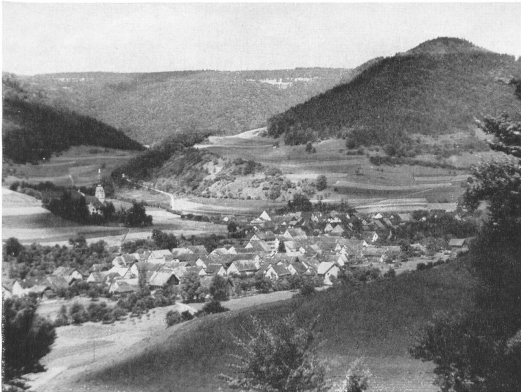
Die wenigen, geschlossenen Dorfsiedlungen in den Randentälern haben ihren ländlichen Charakter bis heute weitgehend erhalten. Merishausen mit Hochranden