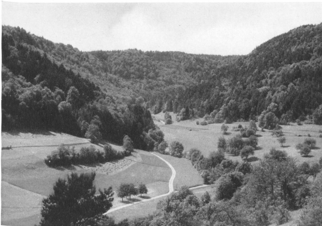
Die Steilhänge des Randengebietes sind in der Regel bewaldet (vorwiegend ursprünglicher, dem Staat oder den Gemeinden gehörender Laubmischwald). Luussen-Cheisental, Gemeinde Merishausen