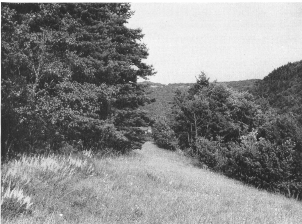
Extensiv genutzte Randenwiese auf Kalkunterlage. An den sonnseitigen Waldrändern siedelt eine licht- und wärmeliebende Flora. Links: Schwarzwerdender Geißklee ( Cytisus nigricans ).

Hintere Stofflenhalde, Gemeinde Merishausen