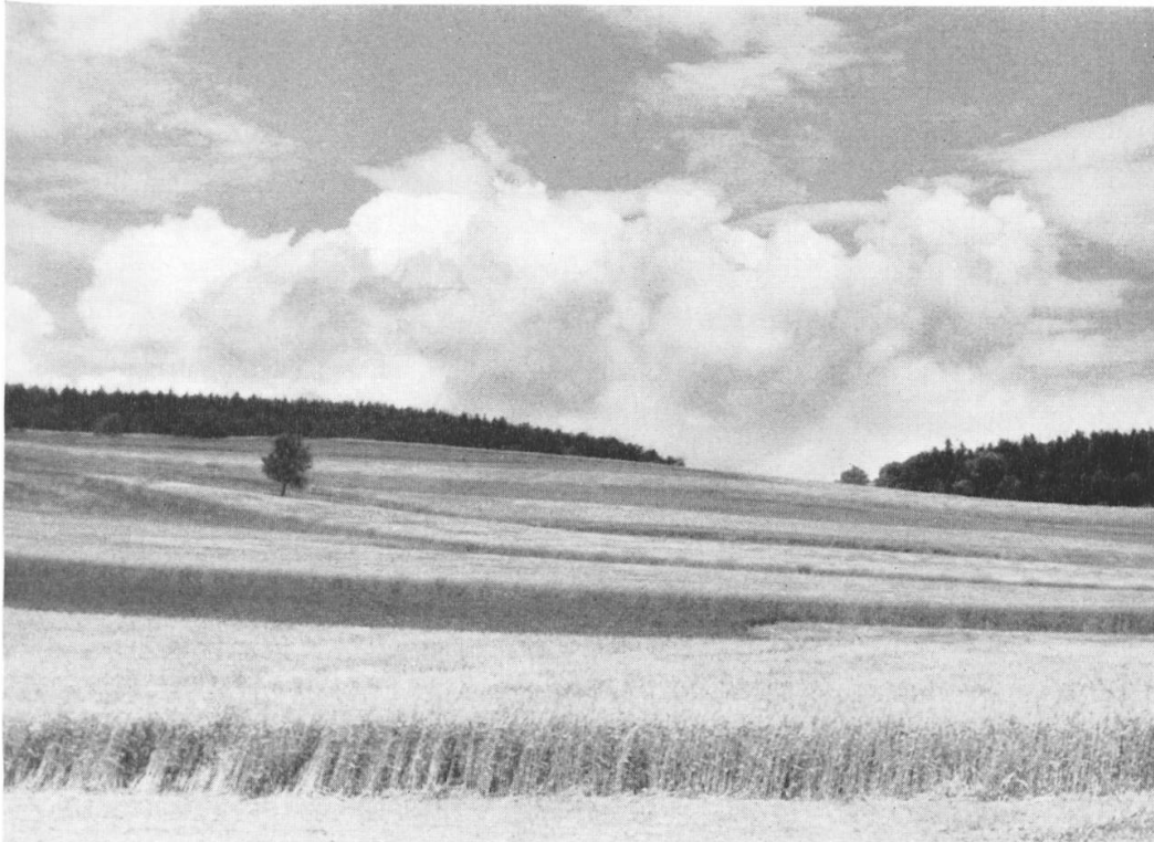
Der Kalk der tiefer gelegenen Teile der Randenhochflächen ist teilweise mit tertiären oder quartären Ablagerungen überdeckt. Diese besseren Böden eignen sich vorzüglich für Ackerbau: Weizen, Gerste, Hackfrüchte (Kartoffeln, Raps, Runkelrüben, Zuckerrüben). Beim Lahnbuck, Gemeinde Schaffhausen