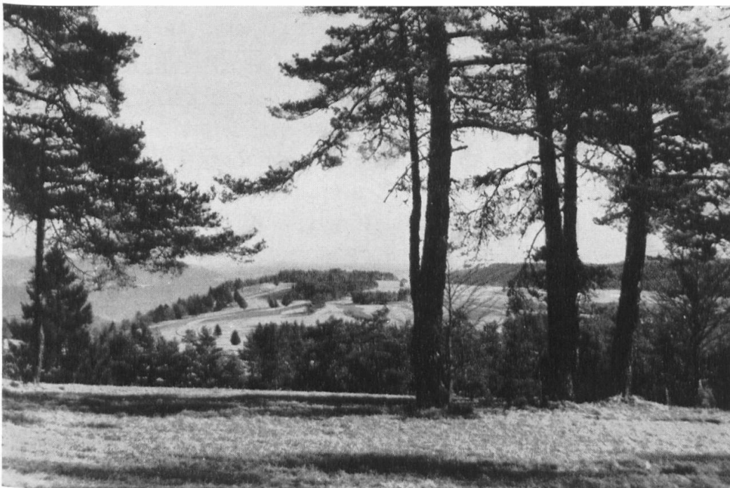
Bedeutende Teile der Hochflächen werden als stark zerstückeltes Privatland landwirtschaftlich genutzt. Die offene Flur ist durchsetzt von Nadelgehölzen, entstanden durch Wiederbewaldung aufgegebenen Kulturlandes. Aetzlisloo-Randenhorn, Gemeinde Merishausen