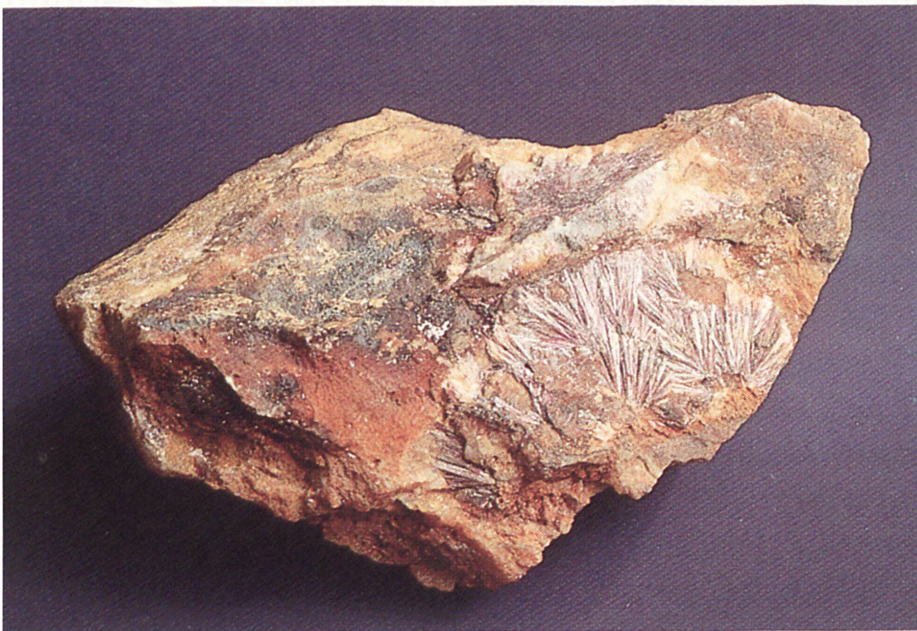
Kobaltblüte (Erythrin) «Weißer Hirsch» – Fundgrube bei Schneeberg