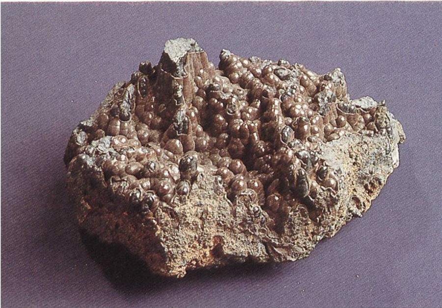
Psilomelan (Hartmanganerz) Grube Riedels bei Langenberg