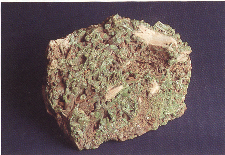
Pyromorphit (Grünbleierz) Fundgrube «Heilige Dreifaltigkeit» bei Zschopau