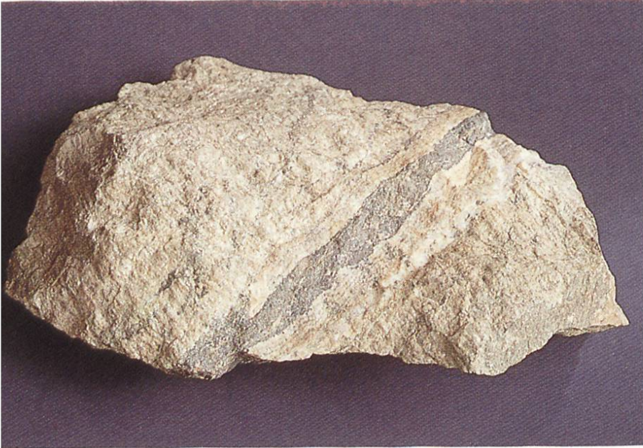
Edle Braunspar- formation «Himmelsfürst» – Fundgrube bei Freiberg