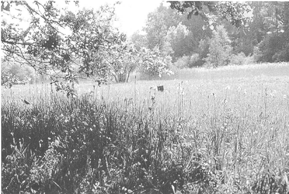
Abbildung 2: Schaarenwis im Frühsommer 1997 mit blau blühenden Iris sibirica.

Der Höherstau führt zu einer Verschiebung der Stauwurzel um 800 m rheinaufwärts. Dies hat die Verkürzung der freifliessenden Rhein-strecke zwischen Diessenhofen und Eschenzerhorn um 8 % zur Folge.