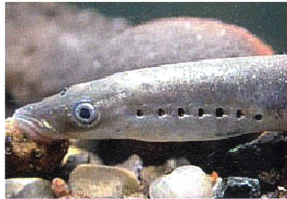
Bachneunauge, ausgewachsen Saugnapf und Tarnfärbung sind entwickelt