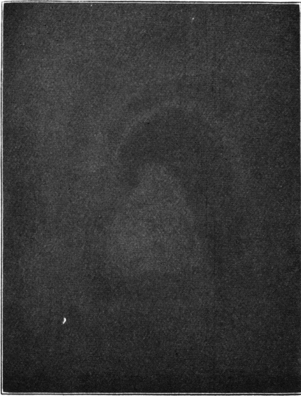
B. Le même, à la verticale.