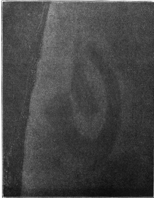
De 2100 m. ; au large de Villette.