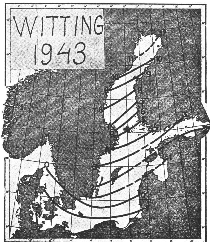
Fig. 9. Isobases des mouvements récents d'après WITTING, 1943.

L'extension du traitement à des séries plus longues (WITTING, 1922, 1943), n'a pas beaucoup changé le tracé des isobases (fig. 9). Les cartes de BERGSTEN