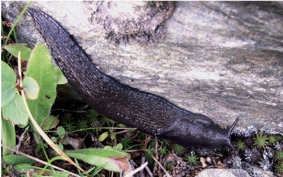
Figure 2.—L'impressionnante limace cendrée ( Limax cinereoniger ) est bien présente dans le Vallon de Nant. En extension, cette espèce atteint une taille de 10 à 20 cm (exceptionnellement 30 !) à l'âge adulte.