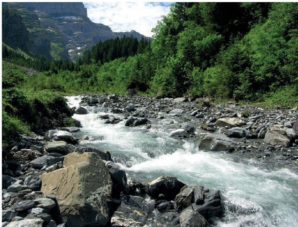
Figure 2.—L'Avançon de Nant, à la hauteur du hameau de Nant, station 11..