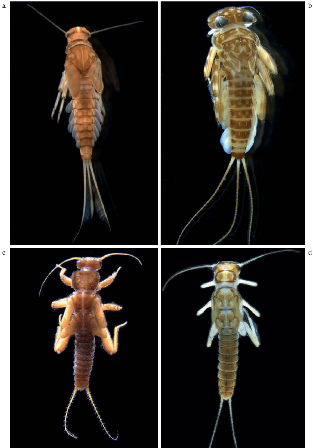
Figure 4.—Insectes aquatiques du Vallon de Nant: a. larve de Baetis sp. (Ephéméroptère, Baetidae); b. larve d' Ecdyonurus sp. (Ephéméroptère, Heptageniidae); c. larve de Nemoura sp. (Plecoptère, Nemouridae); d. larve d' Isoperla sp. (Plecoptère, Perlodidae).