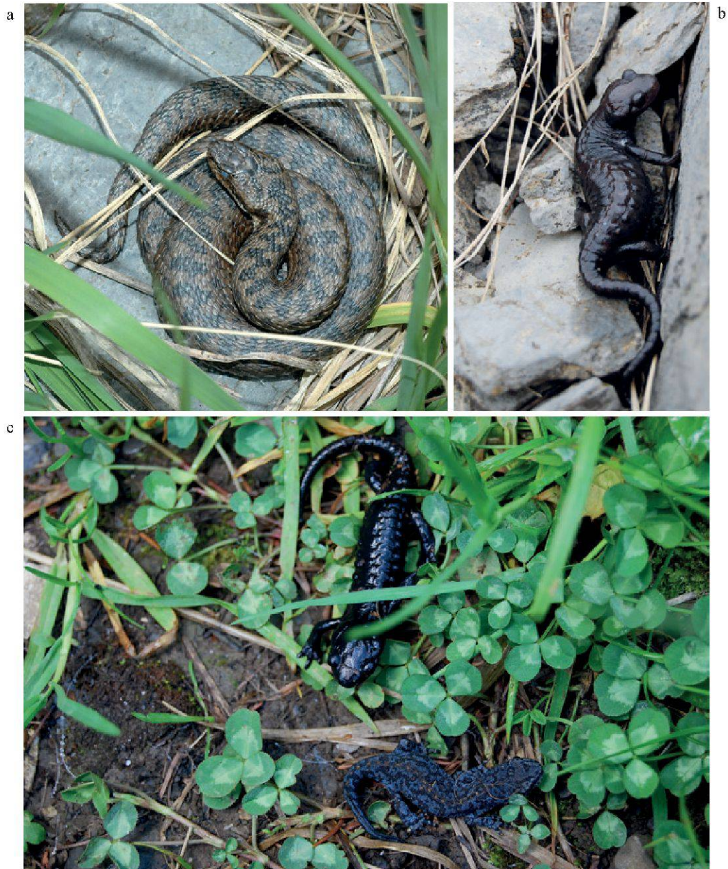
Figure 3.—Batraciens et reptiles du Vallon de Nant:

a. Vipère péliade femelle en phase de mue observée sur la rive gauche de l'Avançon de Nant (Photo: R. Delarze); b. Salamandre noire femelle, de couleur brune observée dans l'éboulis en amont de La Chaux (Photo: J.-C. Monney); c. Triton alpestre (en bas), à ne pas confondre avec la salamandre noire (en haut), observé au bord de l'étang en pied de falaise. (Photo: J.-C. Monney).