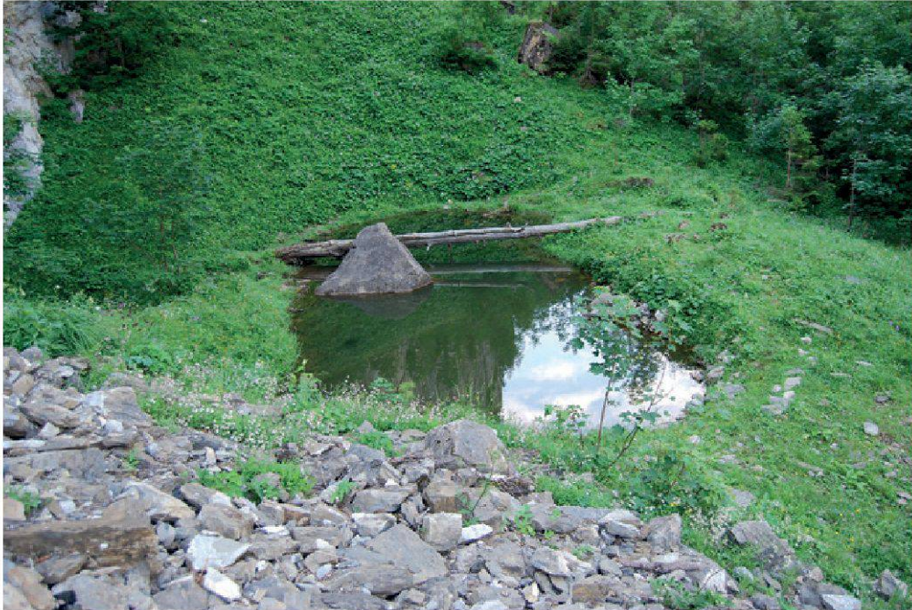
Figure 1.—Vue de l'étang et de l'éboulis situés en pied de falaise en amont du Jardin botanique alpin, sous le lieu-dit «Le Luissalet». Toutes les espèces de batraciens sont présentes sur ce site. (Photo: J.-C. Monney).