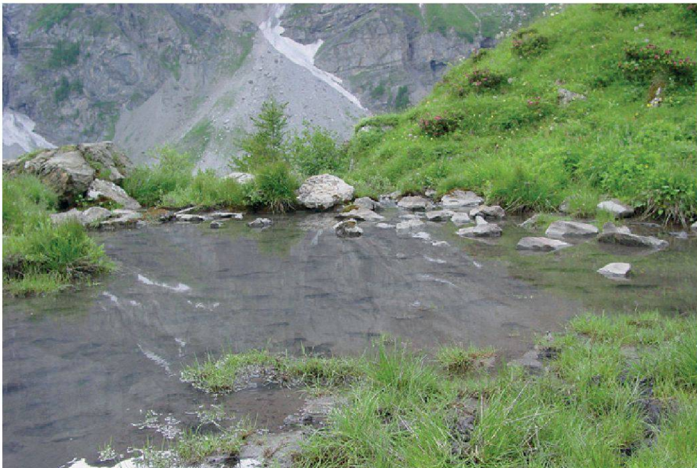
Figure 2.—Vue de la mare située près du chalet de La Chaux. Seule la grenouille rousse a été observée dans ce plan d'eau.