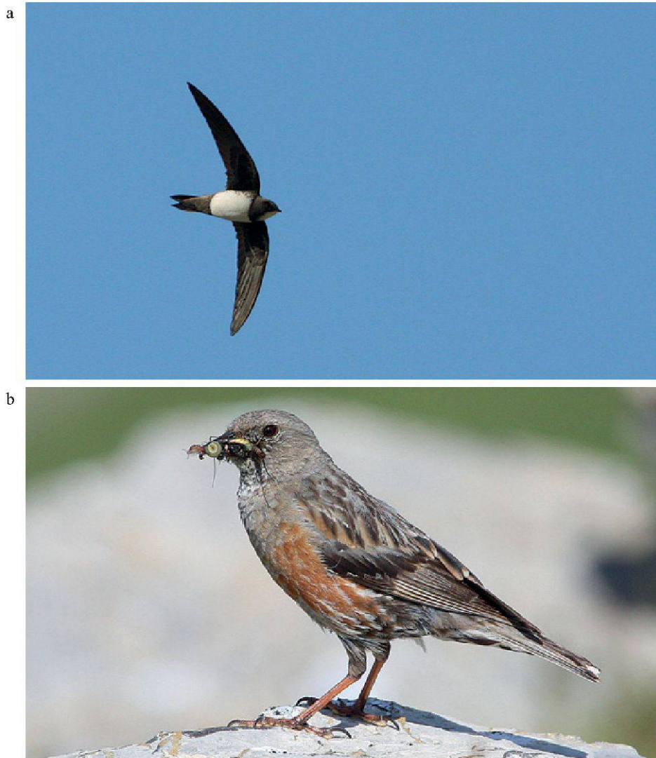
Figure 2.—Quelques espèces présentes dans le Vallon de Nant:

a. Une colonie rupestre de martinet à ventre blanc ( Apus melba ), espèce potentiellement menacée en Suisse, est située à l'entrée du Vallon de Nant (Photo: E. Morard); b. La Suisse héberge 29% des effectifs européens de l'accenteur alpin ( Prunella collaris ). Le Vallon de Nant, où cet oiseau est bien présent, a donc une grande importance pour la conservation de cette espèce. (Photo: E. Morard).