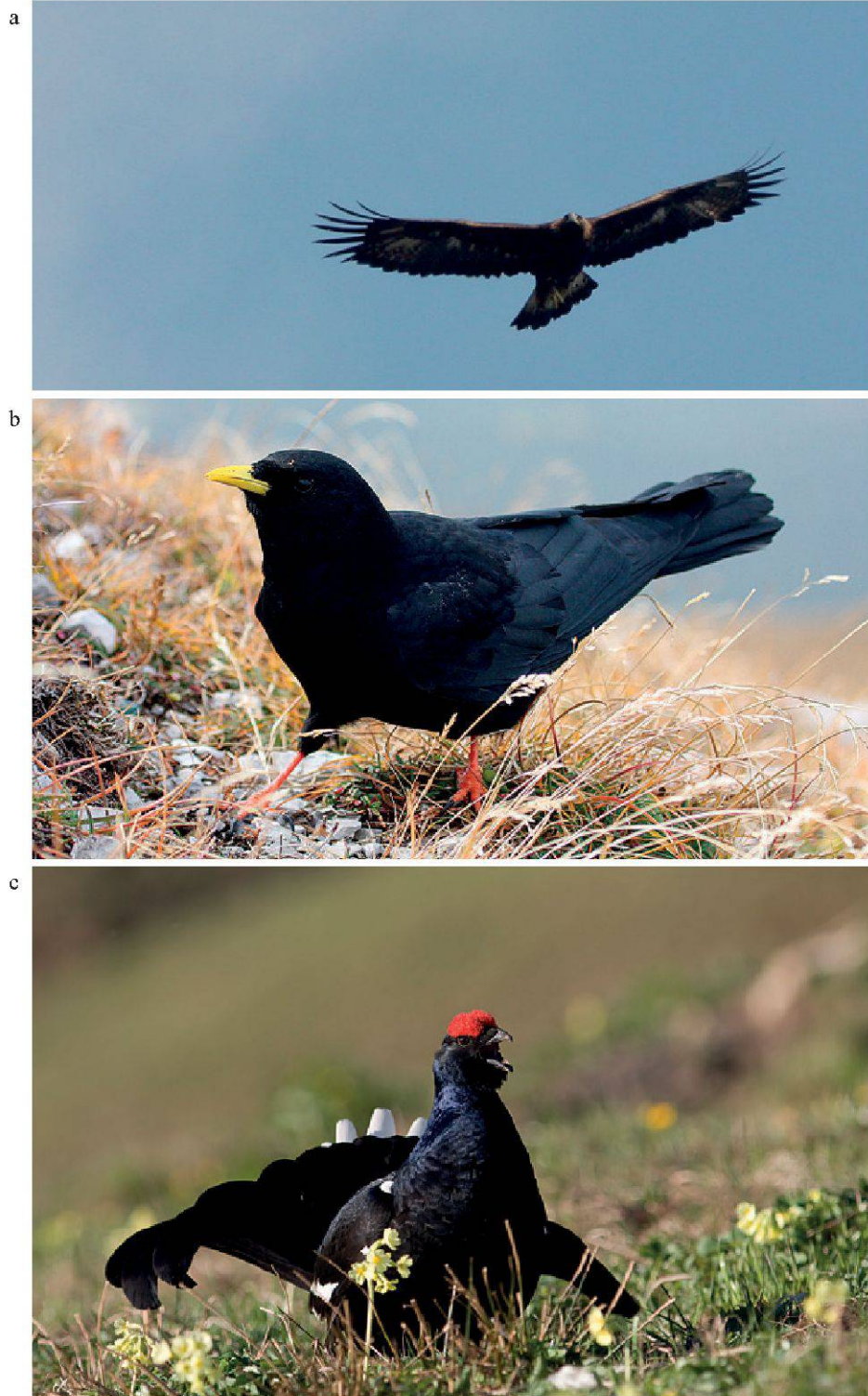
Figure 4.—Quelques espèces présentes dans le Vallon de Nant: a. Aigle royal ( Aquila chrysaetos ) (Photo: E. Morard); b. Chocard à bec jaune ( Pyrrhocorax graculus ) (Photo: E. Morard); c. Tétràs lyre mâle pendant la parade ( Tetrao tetrix ). (Photo: E. et G. Yannic).