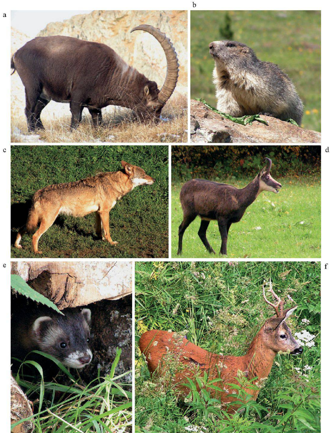
Figure 1.–Quelques espèces de mammifères terrestres du Vallon de Nant: a. Bouquetin des Alpes ( Capra ibex ); b. Marmotte des Alpes ( Marmota marmota ); c. Loup ( Canis lupus ); d. Chamois ( Rupicapra rupicapra ); e. Putois ( Mustela putorius ); f. Chevreuil ( Capreolus capreolus ).