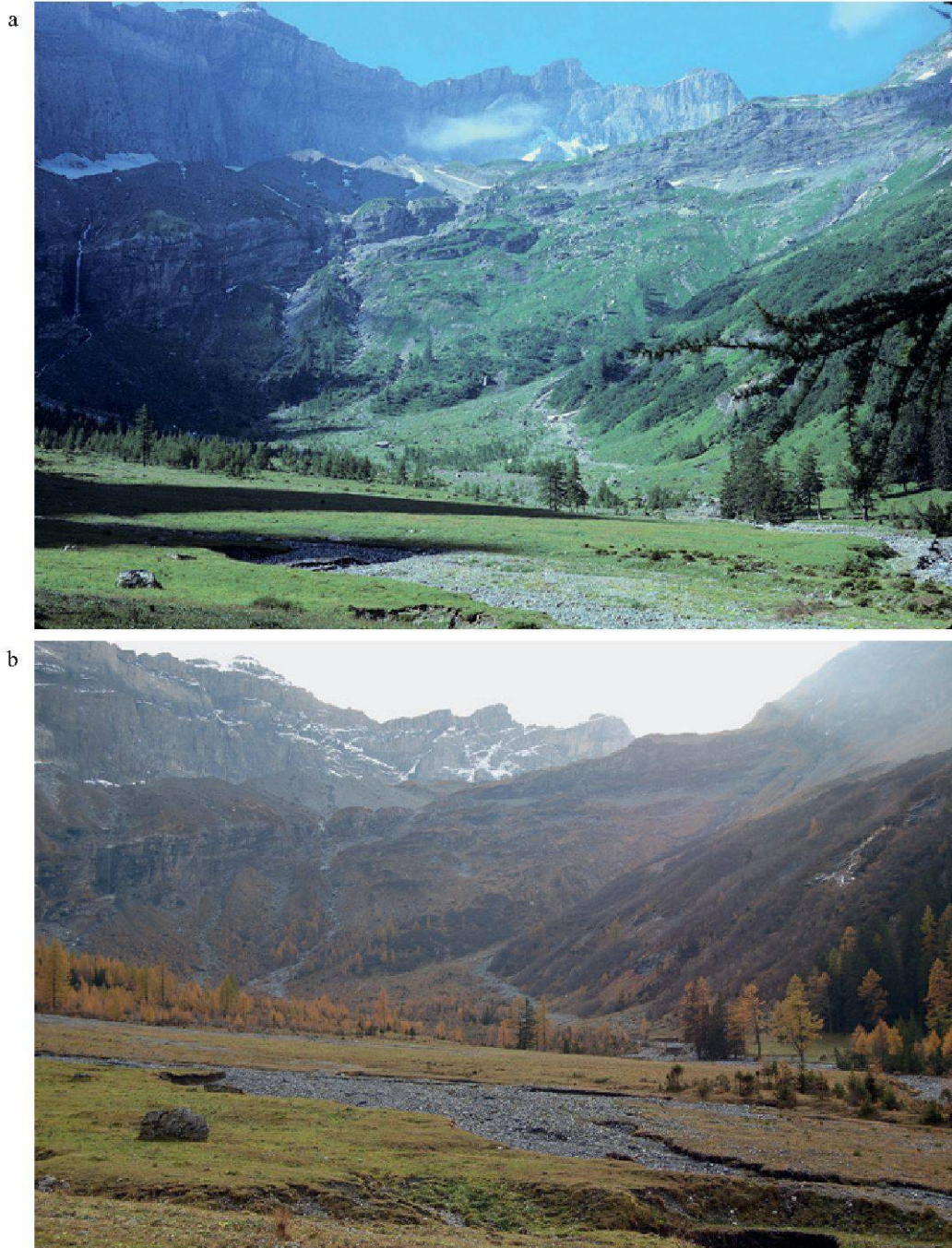
Figure 3.—Evolution de la végétation sous l'alpage de Nant entre (a) 1979 et (b) 2008.