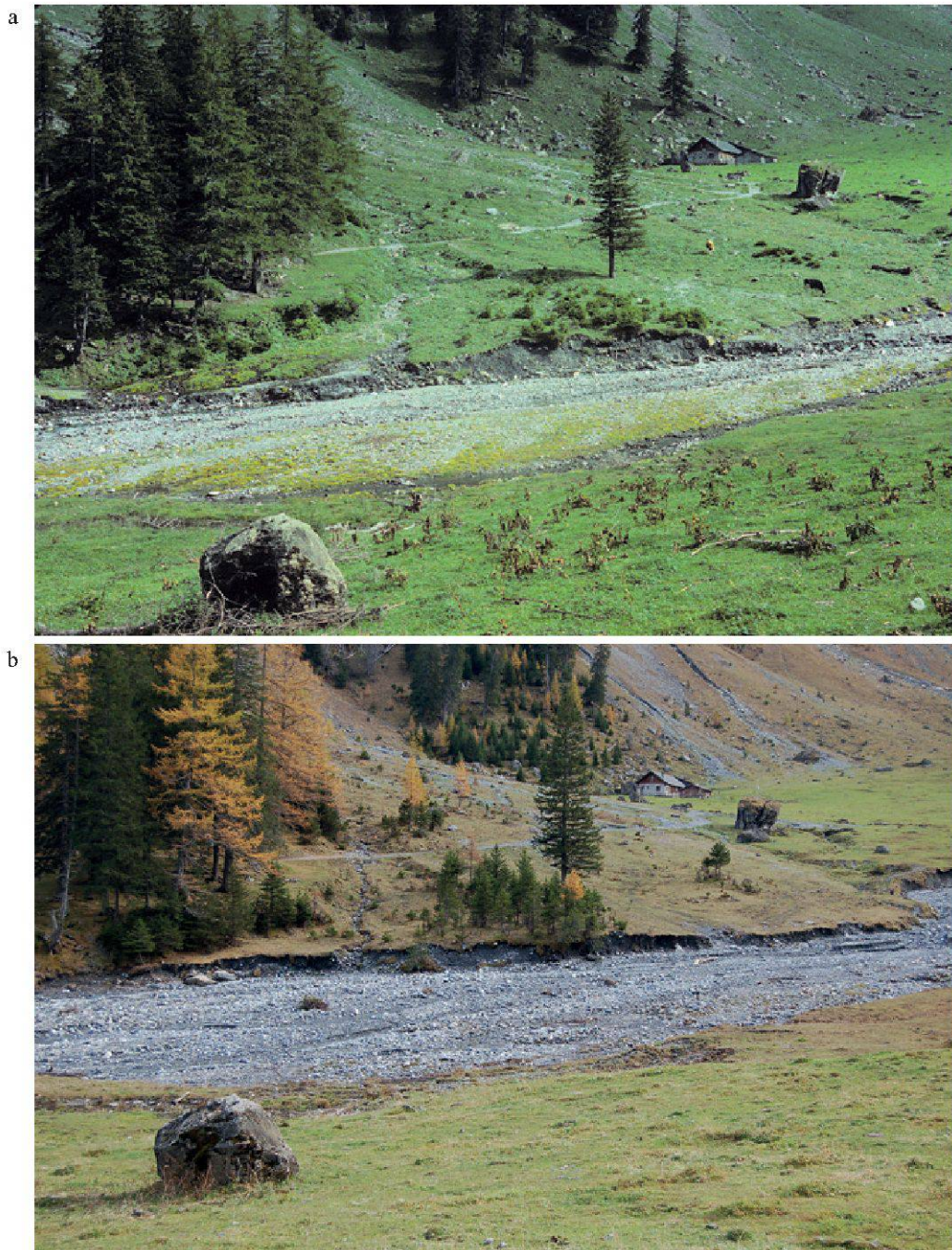
Figure 4.—Progression des arbres et arbustes autour de l'alpage de Nant entre (a) 1980 et (b) 2008 (Photos: (a) A. Dutoit, (b) F. Dessimoz).