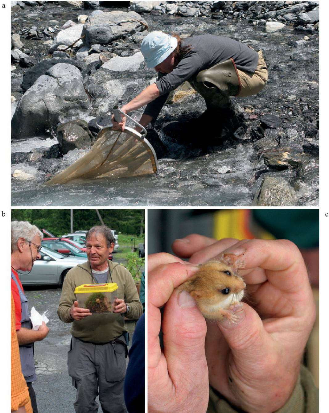
Figure 5.—Les Journées de la biodiversité 2008: a-b. Les naturalistes sur le terrain; c. Muscardin ( Muscardinus avellanarius ).