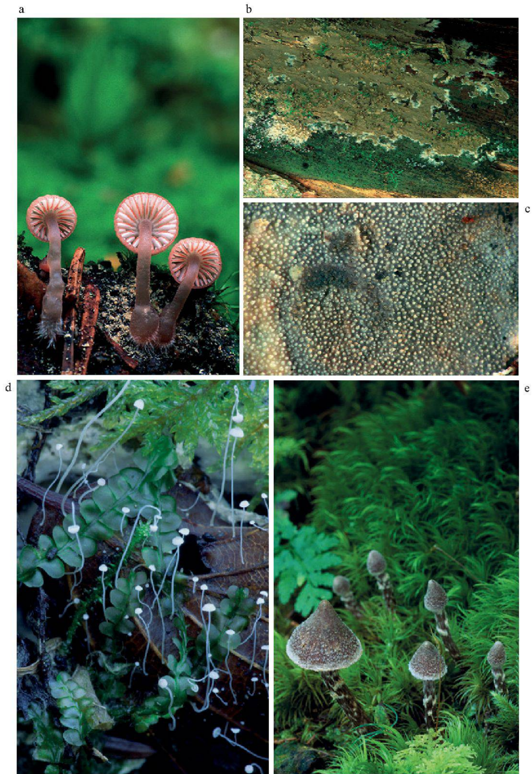
Figure 2.—Quelques espèces de champignons du Vallon de Nant. a. Mycena rubromarginata ; b. Coniophora paleaceus ; c. Scopuloides rimosa ; d. Mycena capillaris ; e. Cortinarius flexipes . (Photos: G. Bieri).