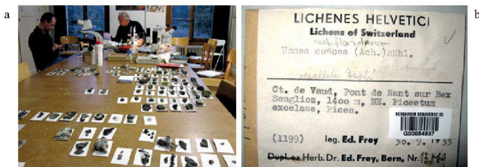
Figure 2.— a. Identification des échantillons récoltés lors des Journées de la biodiversité au Vallon de Nant (Conservatoire et Jardin botaniques de la Ville de Genève, novembre 2008). b. Echantillons du Vallon de Nant trouvés dans la collection d'Eduard Frey, qui fut l'un des meilleurs connaisseurs des lichens alpins, collection actuellement conservée dans l'herbier des Conservatoire et Jardin botaniques de la Ville de Genève. (Photos: C. Truong).