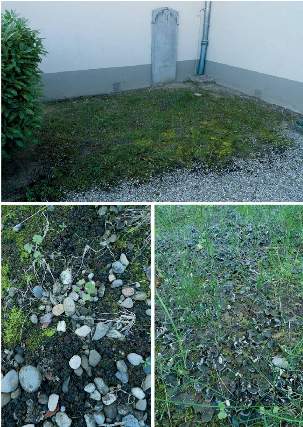
Planche 23. Les gazons aux alentours des habitations sont parfois favorables aux lichens terricoles si le tapis herbacé n'est pas trop dense, comme lorsqu'ils sont régulièrement tondus en station chaude et sèche ou en montagne, ou encore comme ici à l'ombre d'une église. Les Collema et les Peltigera sont les colonisateurs habituels de tels gazons épars ( Collema tenax , en bas à gauche, et Peltigera neckeri , en bas à droite). Station trouvée et photographiée en 2010 à Avusy (GE).