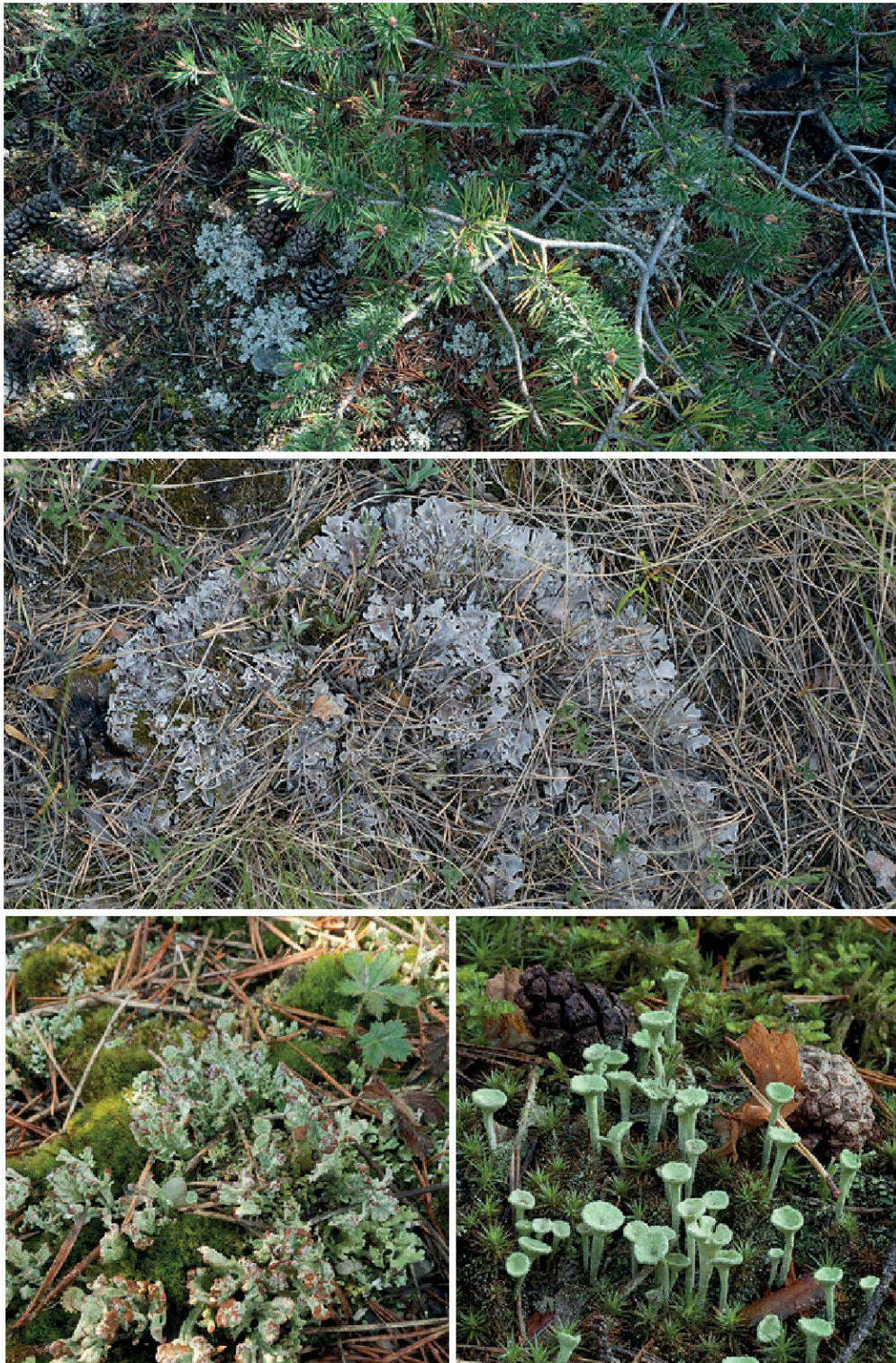
Planche 32. Le sous-bois des pinèdes xérophiles accueille des lichens sur l'humus d'aiguilles tels Stereocaulon incrustatum (en haut) et Peltigera rufescens ou sur la mousse comme Cladonia cariosa (en bas à gauche) ou Cladonia fimbriata (en bas à droite).