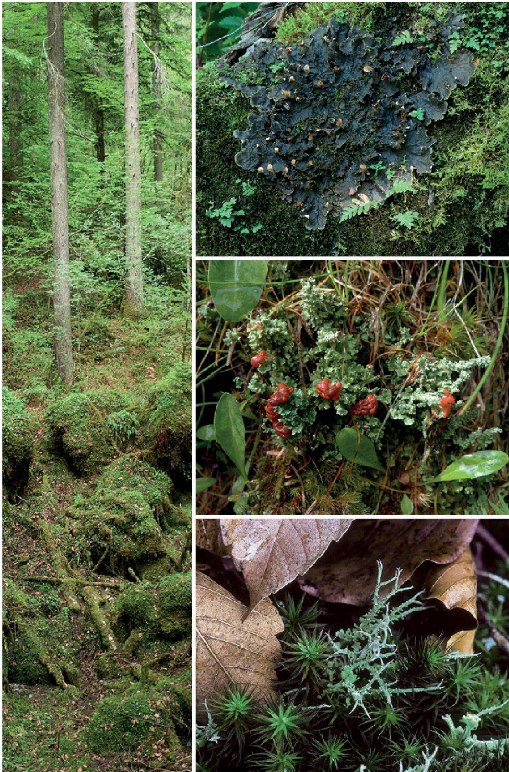
Planche 33. Les pessières comportent entre autres des lichens foliacés et fruticuleux sur les mousses des rochers et du sol, tel Peltigera praetextata (en haut), Cladonia bellidiflora (au milieu) ou Cladonia furcata (en bas).