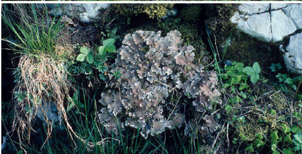
Planche 29. Dans les prairies de fauche ou les pâturages les lichens terricoles ne peuvent se développer que sur des structures telles les affleurements (en haut) ou les murs de pierres sèches, à l'exemple de Peltigera canina (en bas).