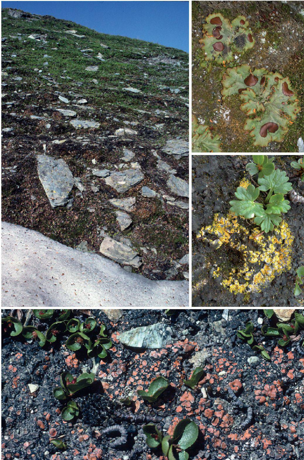
Planche 28. Les lichens des combes à neige. Il s'agit surtout d'espèces crustacées ou foliacées aplaties, n'offrant aucune prise à la neige, telles Solorina crocea (en haut), Fulgensia bracteata et Psora decipiens (en bas).