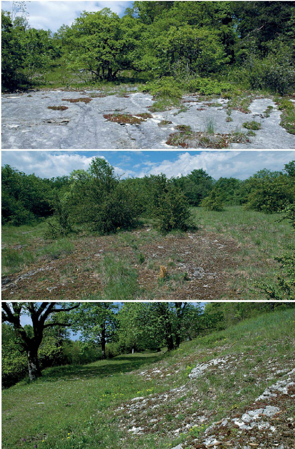
Planche 24. Plusieurs exemples de dalles calcaires : a) encore apparente, au Landeron (NE); b) en voie de colonisation par les mousses, les lichens et les plantes grasses, à Ferreyres (VD); c) en affleurement dans le pâturage du Pré d'Orvin (BE).