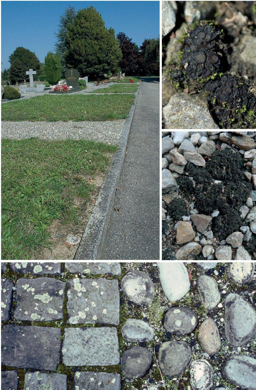
Planche 34. Plusieurs milieux anthropogènes accueillent des lichens terricoles, comme les cimetières, notamment sur le bord des allées de gravier, en marge des pelouses et parmi les pavés. Collema tenax (en haut) et C. crispum (au milieu) y sont fréquents.