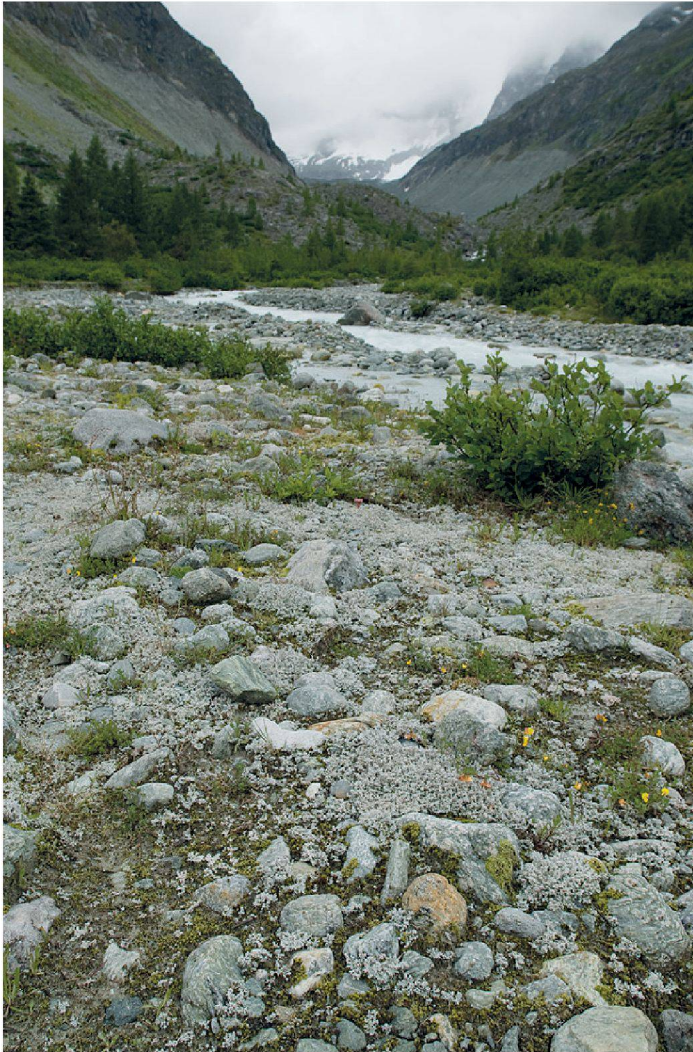
Planche 21. Terrasse alluviale alpine au-dessus de Zinal (VS) comportant Stereocaulon alpinum (lichen fruticuleux gris) colonisant la terre nue parmi les alluvions grossières.