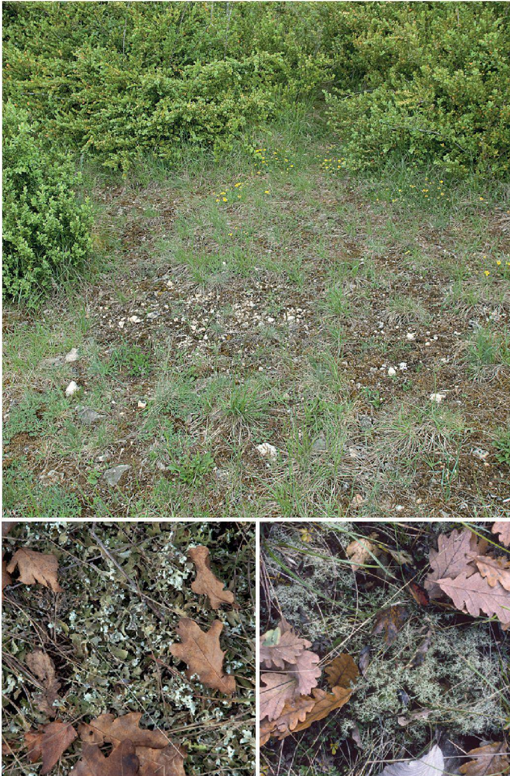
Planche 26. Végétation épaisse caractéristique du Xerobromion , à La Sarraz (VD). Plusieurs lichens foliacés ou fruticuleux s'y développent, comme Cladonia foliacea (en bas à gauche) et Cladonia ciliata (en bas à droite).