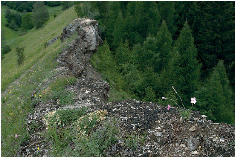
Planche 27. En haut: au-dessus d'Ardez (GR) le paysage se compose d'une mosaïque de prairies maigres et sèches sur les collines rocheuses et de prairies grasses sur les sols profonds. Autant ces dernières ne laissent aucun interstice pour les lichens terricoles, autant les premières comportent d'importantes lacunes dans le tapis herbacé, lacune de terre nue colonisées par de multiples espèces pionnières de lichens terricoles.

En bas: Alors que la pente couverte de pelouse mi-sèche présente une végétation trop dense, son sommet, plus exposé et sec, à la limite avec un ravin alluvial, offre les conditions favorables au développement des lichens terricoles (Grisons).