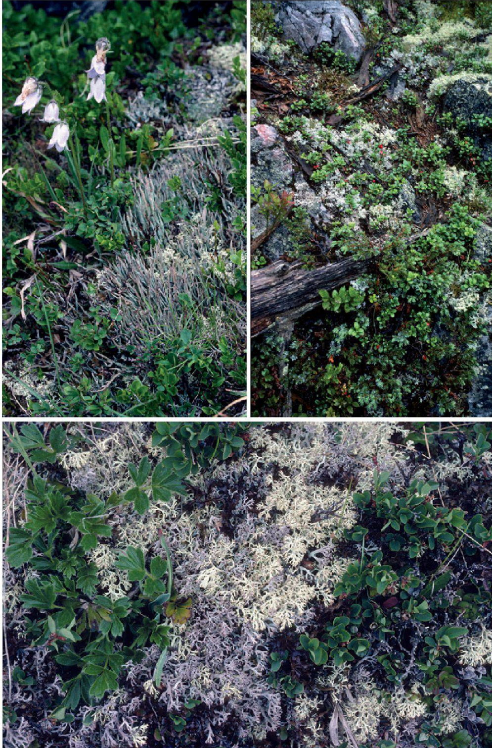
Planche 30. Les landes alpines sont souvent favorables aux lichens, notamment de nombreuses espèces de cladonies : Cladonia ecmocyna (en haut à gauche), C. arbuscula (en haut à droite) et C. arbuscula (jaune-crème) avec C. rangiferina (gris) (en bas).