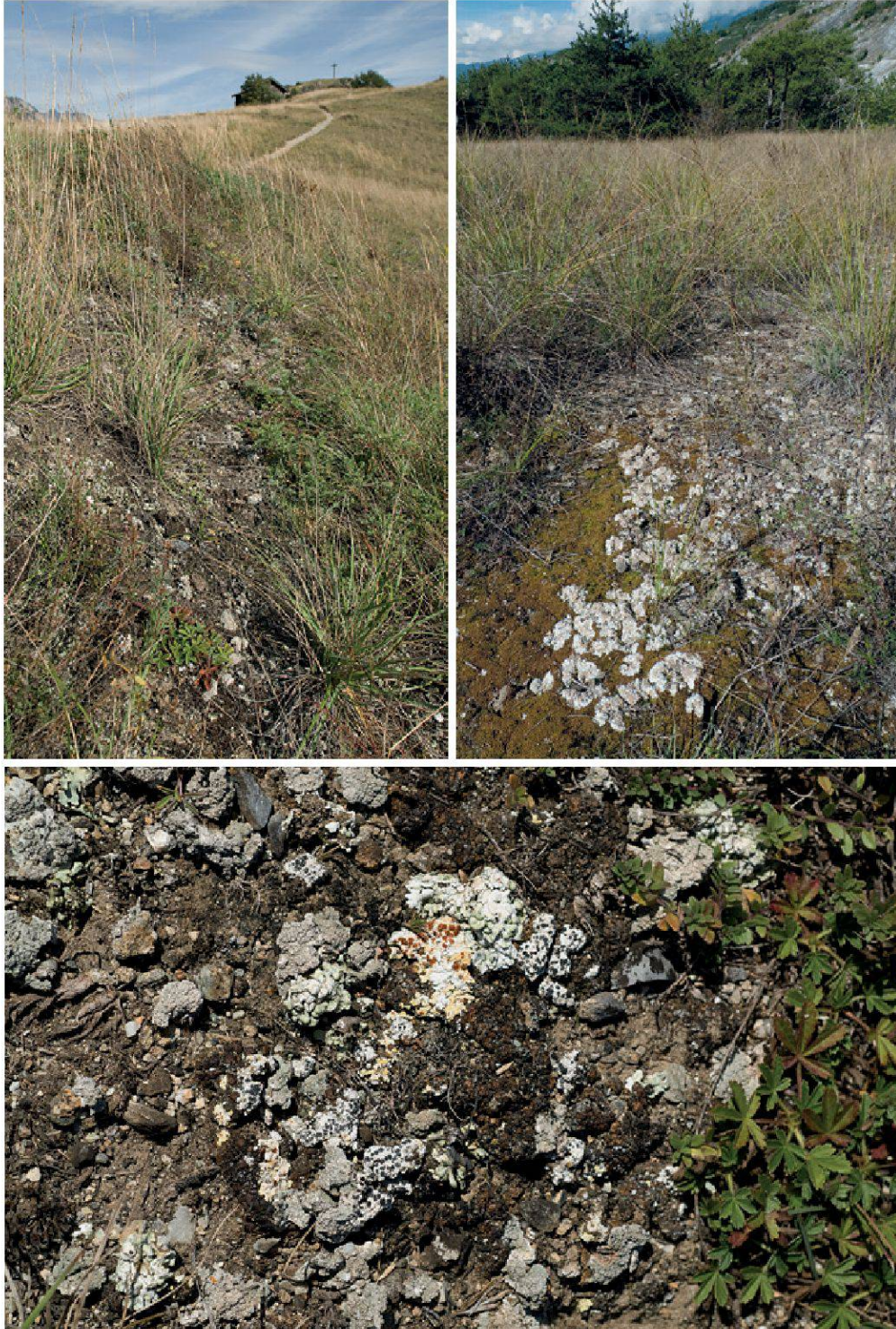
Planche 25. Les pelouses steppiques se rencontrent en Valais central sur l'adret rocheux, en ubac sur des flancs exposés aux vents (Charrat, en haut à gauche), ou sur les sables drainants des alluvions du Rhône à Finges (en haut à droite). Les lichens terricoles y sont avant tout crustacés (en bas).