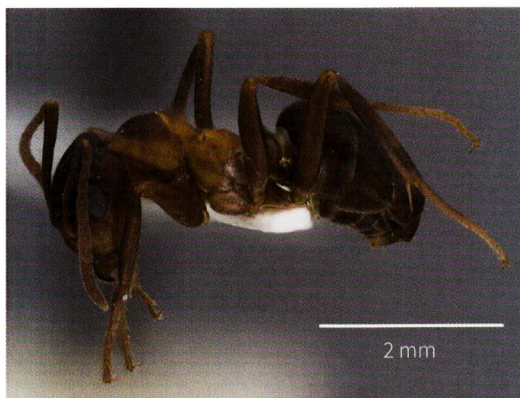
Figure 4: Formica bruni , espèce en danger d'extinction au niveau suisse, disparue du Bois de Chênes depuis sa dernière observation en 1984.