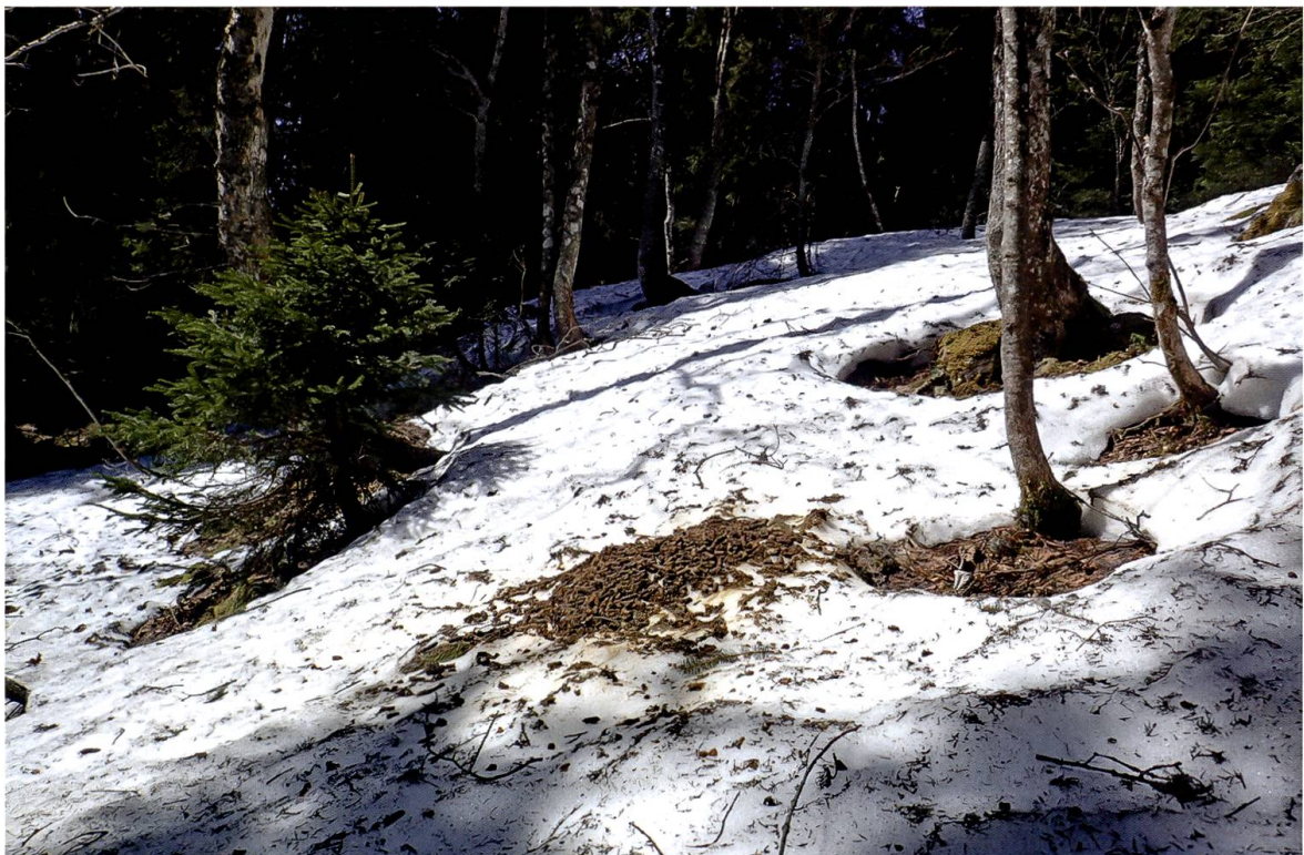
Figure 2. Traces de pas et amas de crottes de grand tétras observés lors des relevés d'indices au sein des forêts de Montricher.