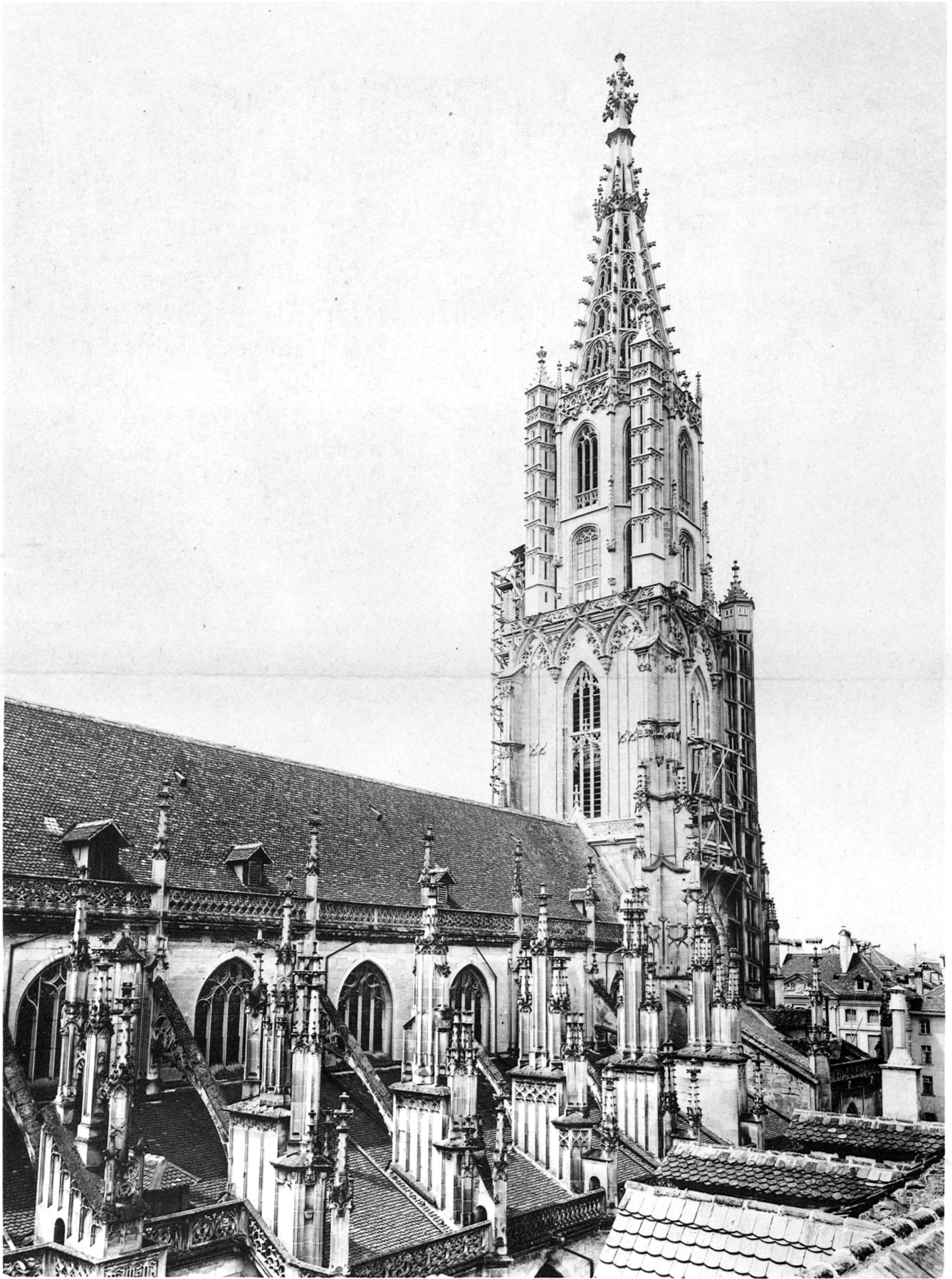
Ausgebauter Turm des Berner Münsters. Aufnahme von Nordosten, vom Dache des Hauses No. 4 Kirchgasse.

Verlagsanstalt Benziger & Co. A. G. in Einsiedeln.