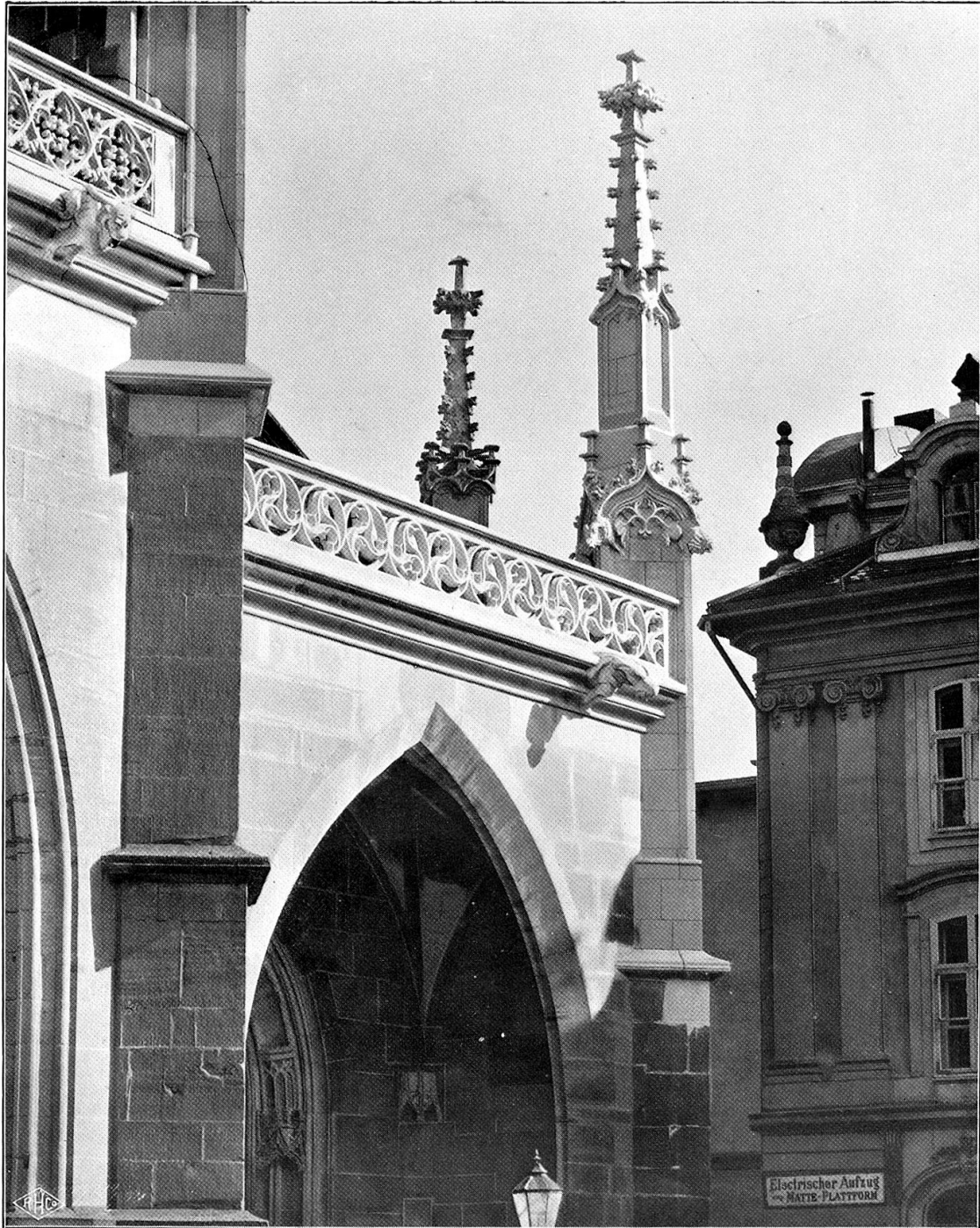
Fiale und Galerie Südwestecke gegen Münsterplatz