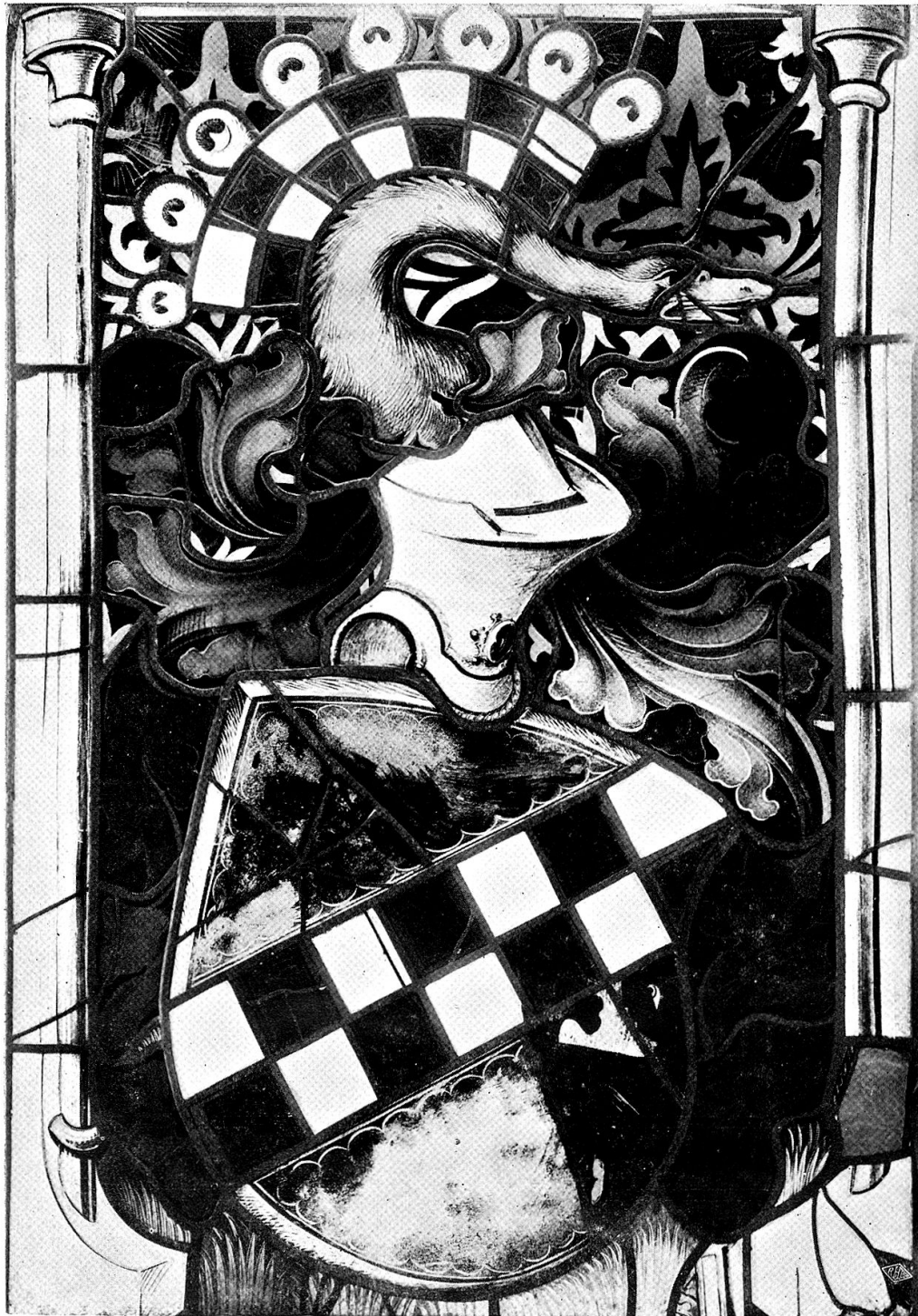
Scheibe des Bernhard de la Marck 5. Fenster (Nordseite)