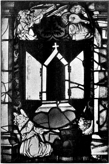
Scheibe der Karthause Torberg 6. Fenster (Nordseite)