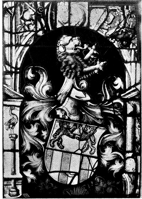
Scheibe des Bartlome May 7. Fenster (Nordseite)