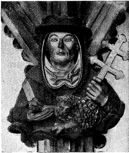
St. Hieronymus als Kardinal.

Az. Im Jahr 1430 begann Matthäus Ensinger den Bau des Chors , nachdem er neun Jahre lang den Kapellenkranz um das Langhaus der alten Kirche gezogen hatte. 1441 waren die Mauern auf ca. 20 m Höhe gediehen, denn das erste Glasfenster im Chor, das Mittelfenster, konnte damals verdingt werden. Unmittelbar nachher wird die Erstellung des Dachstuhls anzusetzen sein. Kurz nach 1448 beweist eine Bemerkung bei der Beschreibung des fünften Chorfensters, dass von der innern künstlerischen Ausstattung der Priesterdreisitz bereits fertig war; eine andere Notiz zwischen 1436 und 1455 spricht vom Sakramenthäuslein zwischen dem zweiten und dem dritten linken (nördlichen) Chorfenster. Vom ersten, hölzernen Lettner ist noch der Riss erhalten, der die Entstehung den 1450er bis 1460er Jahren zuweist. 1454 wurde der erste Organist angestellt, welcher die beiden kleinen Orgeln am Triumphbogen zu bedienen hatte. Kurz: um 1460 war der Chor fertig erbaut und konnte in Gebrauch genommen werden. Er war provisorisch mit einer flachen Holzdecke versehen und ganz unter der Leitung und nach den Plänen von Matthäus Ensinger errichtet worden. — Ensingers Nachfolger empfanden das Fehlen des Gewölbes um so störender, als etwa 5 m unter der Decke die Gewölbeanfänger sichtbar aus der Mauer hervorsprangen. Als