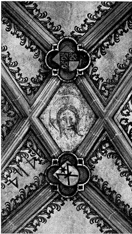
Abb. 3. Mittelpartie des Gewölbes vor der Lombachkapelle.