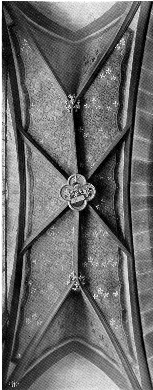
Münster in Bern. Gewölbe der Brüglerkapelle.