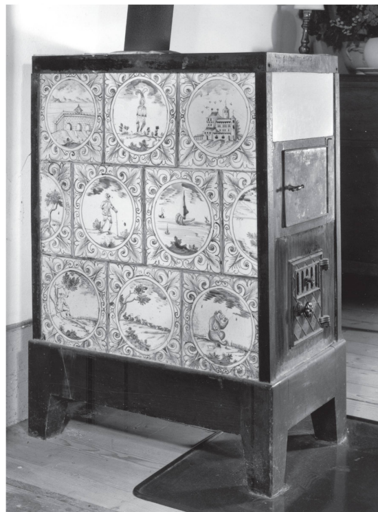
2 Poêle à armature métallique du début du XX e siècle réutilisant des catelles anciennes. La plupart appartiennent à la même série que celle qui montre les armoiries Bourgeois et la date de 1749 (Vulliens, ancien atelier du peintre Eugène Burnand, Seppey. Rédaction des MAH et Office PBC du canton de Vaud.).

Ce vitrail a été réalisé à l'aide de beaux verres cathédrale «dits américains» 13 , teintés dans la masse. Le verrier a joué avec les marbrures des verres, qu'il utilise avec prédilection dans sa production, mais aussi avec le traitement de leur surface chenillée afin de donner vie et profondeur à la scène. Les plombs, qui enserrant les verres, soulignent les lignes de force du dessin. Excepté le texte des armoiries