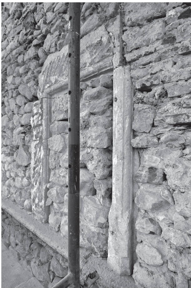
5 Cure de Chavornay, façade orientale. Fenêtre double à meneau de l'étape 2, dont ne sont conservés que le piédroit méridional, le meneau et le cordon entre les étages formant tablette (A. Jouvenat-Muller - Archéotech SA).