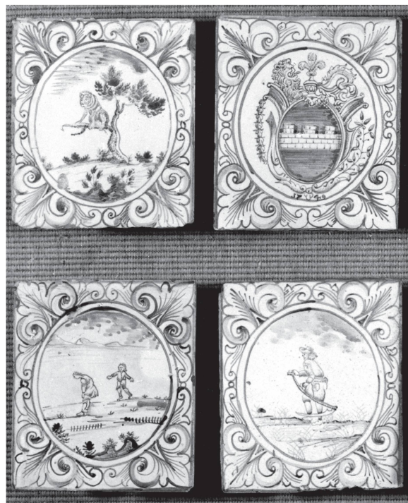
3 Quelques catelles d'un poêle identique, lors du démontage (Chapelle/Glâne. Rédaction des MAH et Office PBC du canton de Vaud. Photo Claude Bornand).