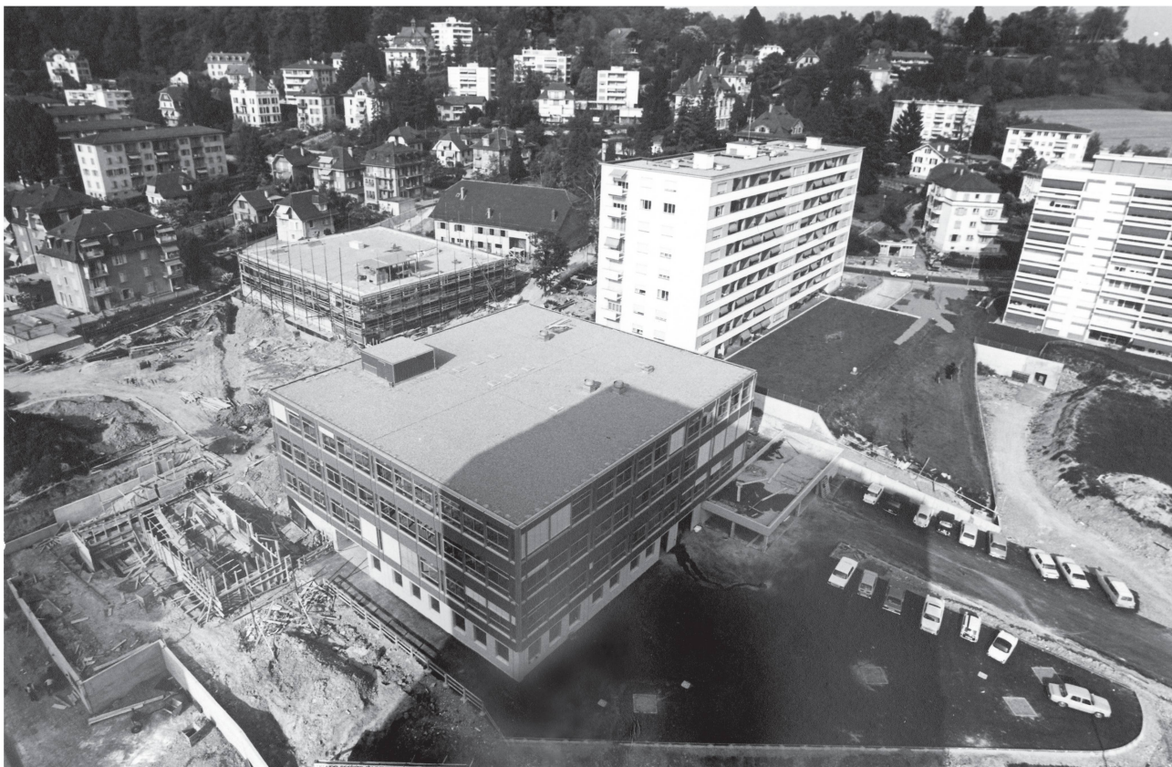
2 Le collège et le quartier de la Rouvraie en 1970-71 (AVL, CA/31/1228).

La pratique jusqu'alors en vigueur consistait à désigner un architecte sur la base d'un programme fruit d'une addition de besoins peu structurée, qui :