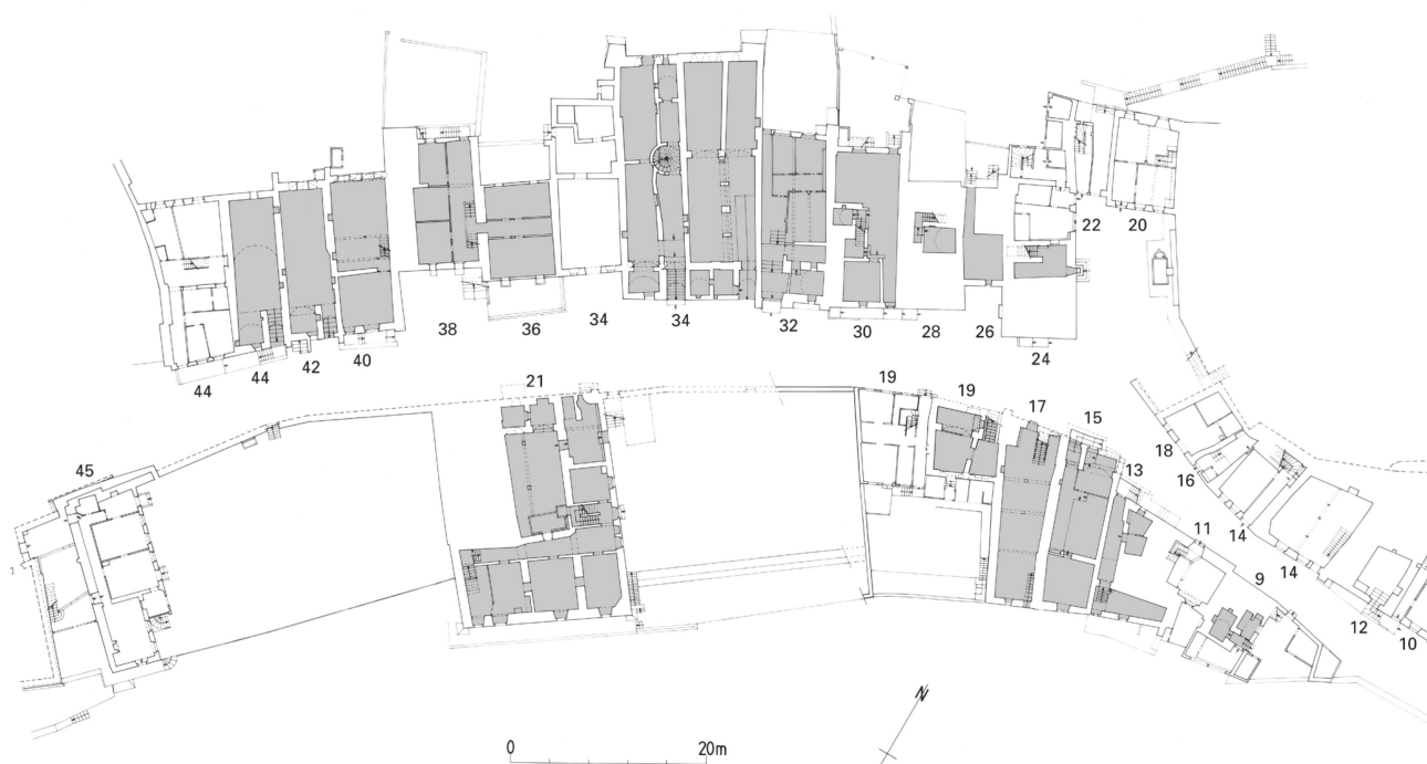
1 Moudon, plan des caves de la rue du Château, partie correspondant au quartier primitif du castrum (Dessin Eric Kempf 1990, tiré de FONTANNAZ 2006 [cf. note 1], p. 48).