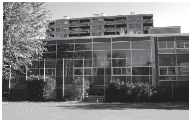
3a-b La façade de la salle de gymnastique avant et après travaux (Ville de Lausanne, Service d'architecture).

modules de base de six classes sur deux niveaux en «L», qui peuvent être combinés en fonction des besoins et du terrain. D'une expression architecturale très différente de celle des CROCS – béton, brique de parement, menuiseries en bois – les six écoles de Lancy constituent un ensemble remarquablement conservé.