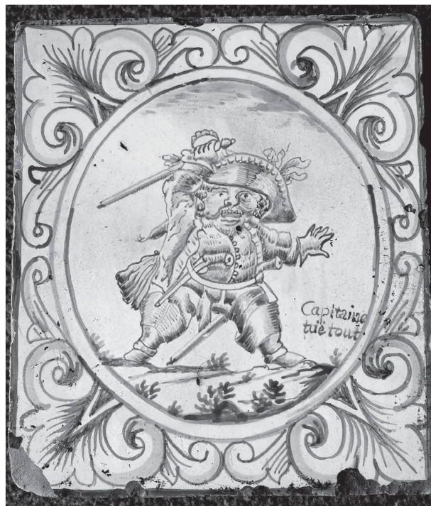
1 Le «capitaine tue tout». Catelle provenant sans doute de la maison Grand-Rue 9-11, comme une autre catelle datée 1749 et portant les armes de la famille Bourgeois (Musée du Vieux-Moudon. Photo M. Fontannaz).

La façade unifiée qui recouvre les trois propriétés de 1747 possède deux rangées de neuf fenêtres, rectangulaires au premier et à linteau en arc surbaissé au second étage.