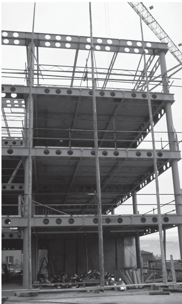
1 La structure du collège des Bergières en cours de construction (AVL, C4/38/1235).

L'histoire de la construction scolaire met en évidence le constant décalage entre les besoins en infrastructures et les capacités de réponse des autorités. Cette recherche d'équilibre est tributaire de l'augmentation du nombre des élèves, proportionnelle au développement de la ville, du nombre et de la qualité des établissements existants et de la rareté des ressources foncières 1 .