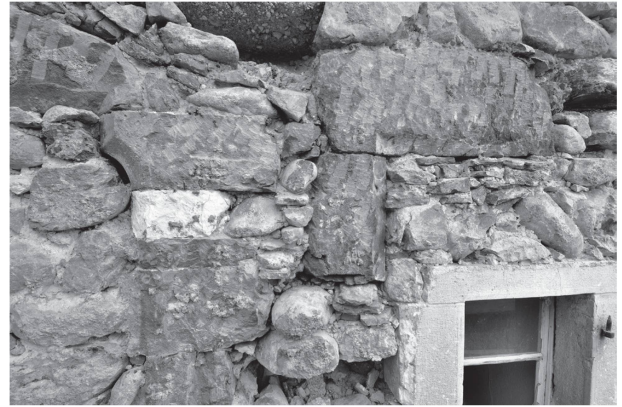
4 Cure de Chavornay, façade occidentale. A gauche, piédroit sud de la porte primitive à encadrement de blocs de molasse décorés d'un large chanfrein qui présentait, sous les blocs qui forment corbeaux, deux blocs de calcaire jaune pâle, probablement à but décoratif; de la fenêtre, de petites dimensions, également à encadrement de molasse avec une légère gorge et des arêtes arrondies, ne subsistent que le linteau et une partie du montant septentrional.

Dans la première moitié du XVII e siècle, le bâtiment atteint son volume actuel (étape 3). Transformée en toit à demi-croupe et coyaux, la toiture est rehaussée et sa pente modifiée, dotant du même coup la construction d'un