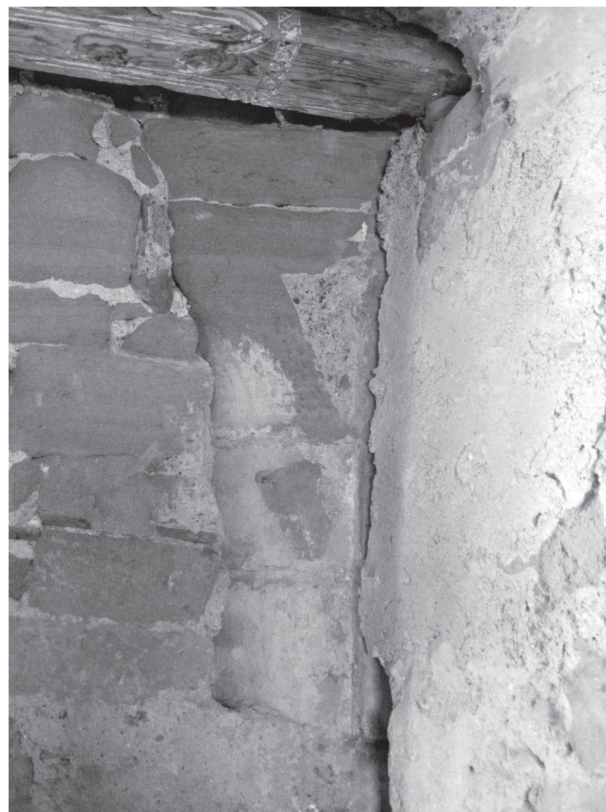
3 Rez-de-chaussée, angle nord-est: détail de la première colonne appartenant au système d'arcades ouvertes sur la rue à l'origine. Vue vers le nord (Photo Ph. Jaton, Moudon).

Les pièces de molasse visibles de ce support 2 (tambours et chapiteau) sont toutes dotées d'un léger retour régulier (6 cm) vers le sud; l'alignement parfaitement vertical que dessine ce dernier situe probablement le piédroit de l'ouverture permettant de passer, à travers le mitoyen, vers la maison voisine en aval (n° 17 de la rue). Du côté