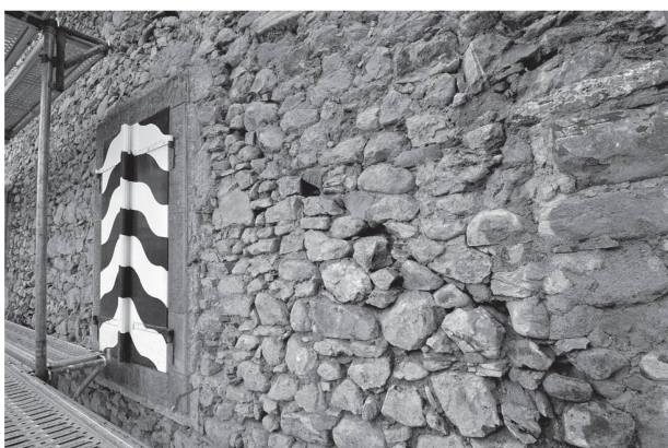
6 Cure de Goumoëns-la-Ville, façade sud-ouest. A droite de la fenêtre (1832), maçonnerie supposée du XIV e siècle avec la pente du toit et, au-dessus, maçonnerie du XVI e siècle.

envergure, elle est probablement antérieure au rachat de la maison puisqu'elle n'est pas mentionnée dans les sources qui concernent la cure. Compte tenu également de la typologie des ouvertures, nous situons donc cette étape entre le début et le milieu du XVIII e siècle.