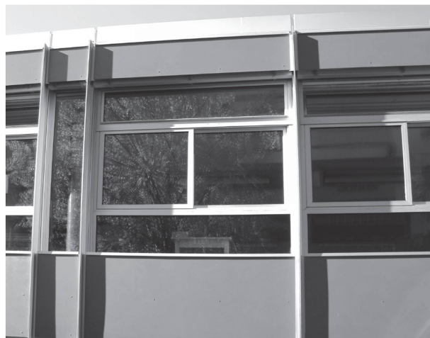
4a-b Détail de façade, avant et après travaux (Ville de Lausanne, Service d'architecture).