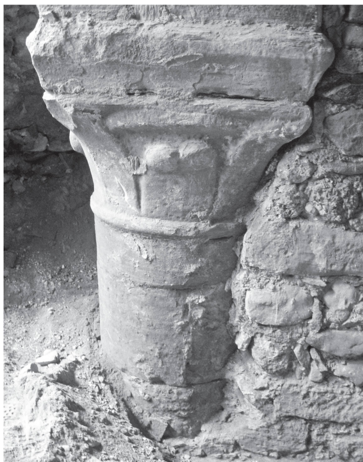
2 Niveau de cave : colonne centrale de la double arcade s'ouvrant vers le sud. Vue vers l'ouest.