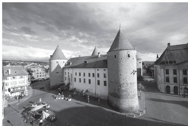
1 Le Musée d'Yverdon et région est abrité dans le château de la ville, construit dès 1260 sur ordre de Pierre de Savoie

En plus de sa mission de conservatoire du patrimoine matériel de la région, le musée s'est donné pour tâche de transmettre l'histoire régionale, exceptionnellement riche et d'un très grand intérêt tant par sa continuité, le Nord vaudois ayant été occupé sans interruption du Néolithique