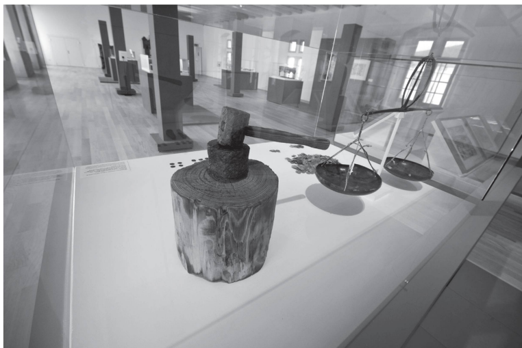
2 La «pré-exposition» présentée dans l'aile ouest du château donne un avant-goût de l'exposition future qui sera consacrée aux périodes médiévale et moderne d'Yverdon et de sa région