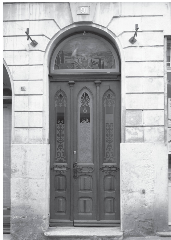
8 Porte d'entrée de la Grand-Rue n° 9 avec son décor néogothique.

Pour conclure, nous ne pouvons que féliciter l'actuelle propriétaire, consciente de l'intérêt et de l'originalité de cet ensemble peint, d'avoir décidé de conserver à cette pièce son caractère. Après un nettoyage doux, on s'est borné à colmater les fentes les plus larges et à unifier la teinte de fond qui avait subi des dommages et des retouches malheureuses. Les motifs décoratifs sont restés intacts. Cette décision courageuse mérite d'être saluée car la couleur dominante relativement sombre et le style du décor ne correspondent pas forcément au goût de tous les locataires. On peut en dire tout autant pour la conservation de la porte avec son décor néogothique, ses verres gravés et son vitrail.