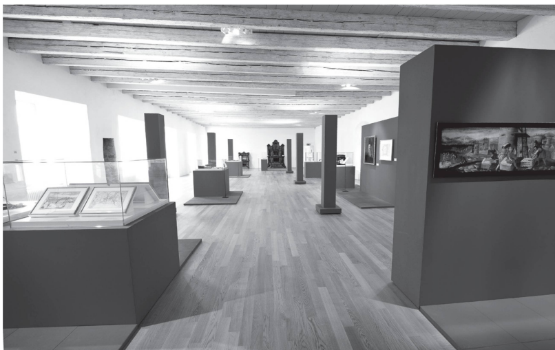
3 La «pré-exposition» présentée dans l'aile ouest du château