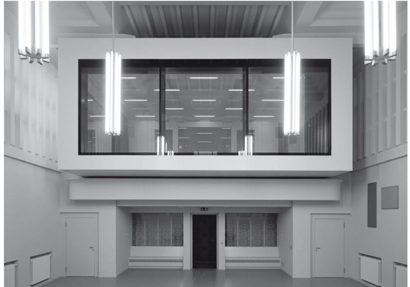
4 Août 2013. Salle polyvalente, côté entrée, nouveau volume fermé posé sur l'ancienne galerie.

édifices religieux, le monument de la Pontaise exprime de façon encore une fois unique la singularité de ce rapport ancestral. Nous ne reviendrons pas sur les deux éléments artistiques figuratifs que sont la sculpture monumentale du « taureau ailé » d'Edouard-Marcel Sandoz et le vitrail de Charles Clément. La singularité architecturale et artistique du monument repose avant tout sur la partition abstraite, colorée et lumineuse du traitement de l'espace de la nef et de ses modifications successives. Installé en 1940 par Paul Lavenex et Eugène Béboux, le cycle des couleurs est le protagoniste permanent de l'espace majeur du monument.