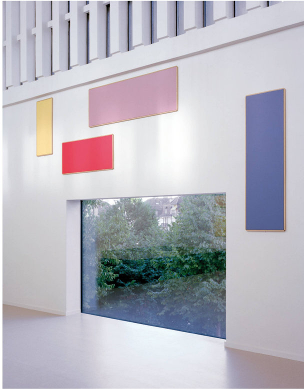
8 Août 2013. Salle polyvalente, œuvres et installation de Francis Baudevin.

de la salle. Comme un hommage posthume à Paul Lavenex, la couleur retrouve, grâce au travail de Francis Baudevin, le rôle que l'architecte avait donné à sa présence dans l'édifice. La couleur n'est plus désormais recouvrement pictural, ou superposition lumineuse. Elle habite l'espace de ses toiles et occupe les murs de sa matérialité. La « maison » convoque l'usage du tableau et concentre sur ses façades intérieures la valeur de son histoire colorée. Loin des effets classiques de l'architecture moderne, à l'opposé des perceptions muséales des collections de tableaux, la grande salle de la Maison de quartier de Saint-Luc continue d'être habitée par la couleur, force pérenne de son histoire.