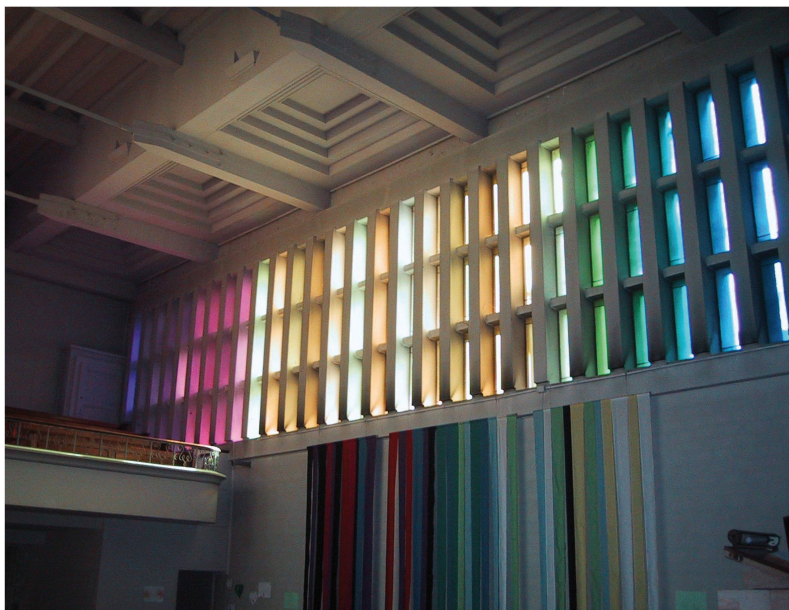
6 Janvier 2003. Salle de culte, transformation de 1968: suppression des peintures de couleur sur les murs et plafonds, coloration des vitraux.