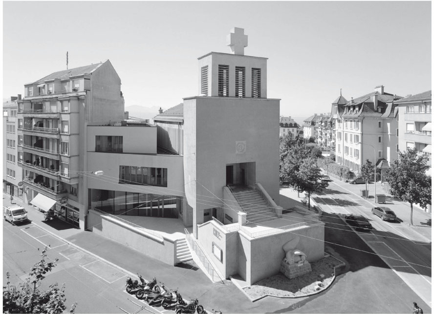
1 Août 2013. Le temple de Saint-Luc après transformation.

compétence de transformer le réel, de modifier la substance matérielle et spatiale de l'architecture dans une continuité et dans une continuation de l'édification donne tout son sens à l'acte patrimonial dialectique. Le projet patrimonial repose sur cette conscience d'édifier, de transformer et de continuer l'œuvre, désormais différente et pourtant toujours semblable.