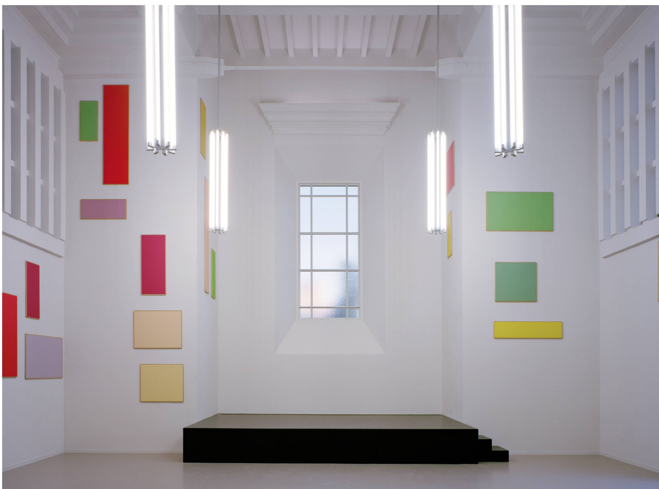
7 Août 2013. Salle polyvalente, œuvres et installation de Francis Baudevin.