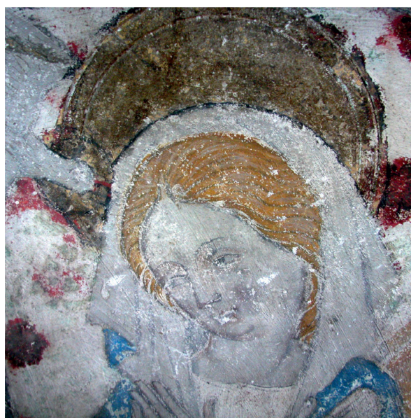
8 Basilique de Valère à Sion (VS), Vierge de l'Annonciation peinte sur le jubé.