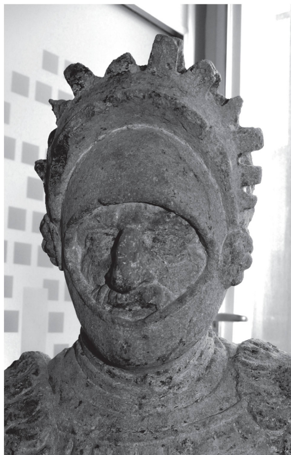
9 Payerne, détail de la statue du banneret provenant d'une des fontaines de la ville.