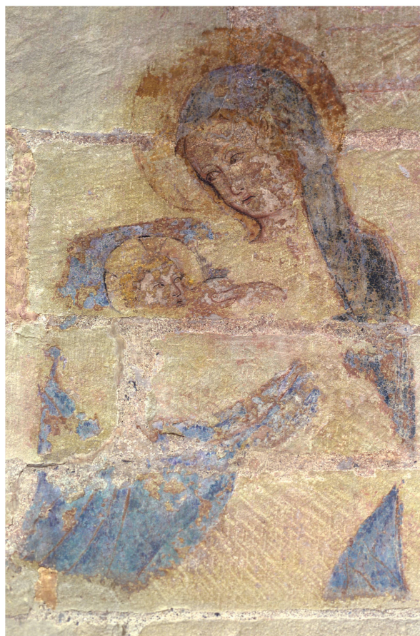
7 Église de Lutry, Vierge allaitant l'Enfant peinte sur la clôture de la chapelle des Mayor.

L'histoire de cette clôture doit être abordée avec beaucoup de prudence, car nous savons uniquement qu'elle n'était originellement pas destinée à son emplacement actuel. Marcel Grandjean avance qu'il pourrait s'agir d'une partie du jubé installé vers la fin du XIII e siècle pour séparer le chœur monastique de la nef paroissiale. Ce jubé aurait été remplacé suite à un incendie en 1344 ou après l'ordre