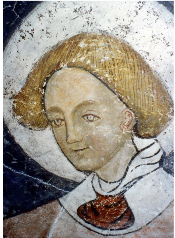
2 Eglise de Corsier-sur-Vevey, détail du symbole de Matthieu peint sur la voûte du chœur.

Quelques siècles plus tard, après avoir longtemps ignoré l'existence de ces peintures et en les redécouvrant, un nouvel enjeu apparaît, à savoir celui de leur conservation et