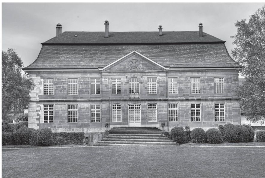
1 Château de L'Isle, vu du sud, en mai 2009. Photographie partagée sous la licence «CC-BY-SA», soit utilisable librement, sous condition de mentionner son auteur et de partager d'éventuelles œuvres dérivées sous la même licence.

son immense popularité. Par là même, les notices wiki arrivent presque toujours en tête des résultats de requêtes et touchent donc un très large public. Bien que gratuite, cette ressource reste cependant largement sous-utilisée dans le domaine de l'histoire et des monuments, alors que les sciences naturelles ou médicales, par exemple, ont mieux compris tout l'intérêt qu'offre cet outil de diffusion. La présente contribution, en explicitant le concept, voudrait sensibiliser le milieu «monumental» au vaste potentiel de ce canal particulier.