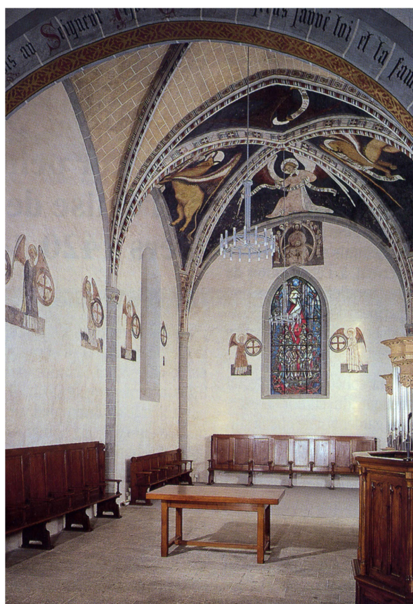
1 Eglise de Corsier-sur-Vevey, vue vers le chœur.

Jusqu'au XV e siècle, les communes de Corsier, Jongny, Corseaux et Chardonne sont réunies sous la même paroisse, à savoir celle de Corsier, et partagent les biens communaux et l'église Saint-Maurice à Corsier 3 . Les Chardonnerets souhaitant célébrer la messe dans leur village, ils acquièrent un terrain et la construction de la chapelle Saint-Jean-Baptiste est approuvée par l'évêque de Lausanne en 1421 4 . Elle devient annexe de la paroisse de Corsier, est réformée en 1536, puis obtient le statut de paroissiale dès 1864. Dès le XV e siècle, le bâtiment subit beaucoup de transformations et réparations, pourtant le décor médiéval, badigeonné par les Bernois et datant des années 1420, n'est découvert qu'en 1999. L'église Saint-Maurice de Corsier-sur-Vevey, quant à elle, est mentionnée dès 1079. Comme Chardonne, elle devient église réformée dès 1536, date à laquelle les décors sont recouverts d'un enduit 5 . La présence des armes et de la devise de la Maison de Savoie témoigne de l'intérêt que celle-ci portait à l'église et nourrit l'hypothèse selon laquelle elle fit agrandir le chœur et commanda son décor vers 1420-1430 6 . L'histoire des deux bâtiments peut en partie expliquer la facture très différente des décors.