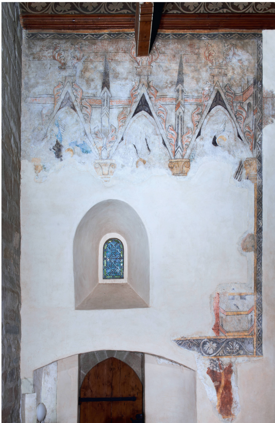
6 Eglise de Saint-Prex, peintures murales ornant le mur sud de la nef.