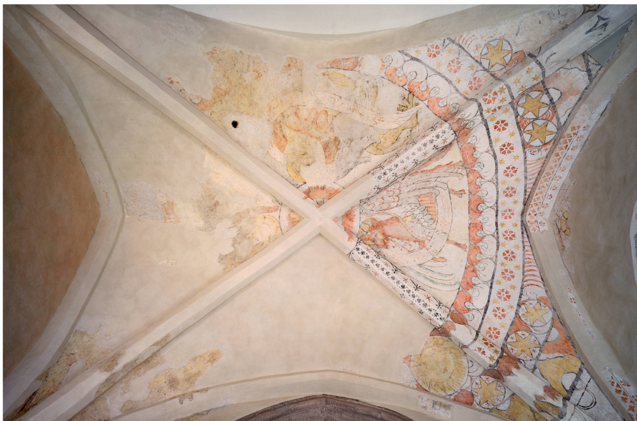
4 Eglise de Chardonne, peintures murales ornant la voûte du chœur.

de leur restauration. Le décor peint du chœur de l'église de Corsier fut l'un des premiers à être mis au jour dans le canton de Vaud en 1887, marquant ainsi le début de nombreuses découvertes sous les badigeons de la Réforme, alors que celui de Chardonne fut l'un des plus récents, en 1999 : plus d'un siècle d'écart, caractérisé par des changements manifestes dans la restauration de décors peints.