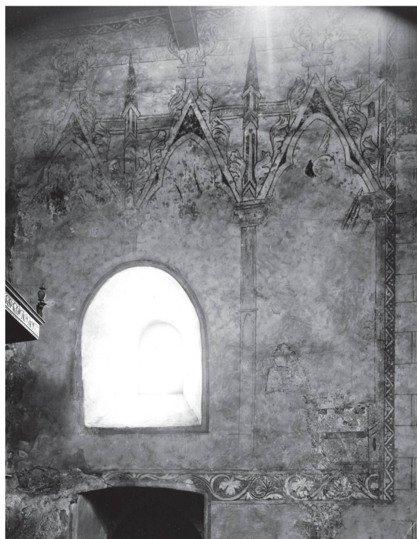
5 Eglise de Saint-Prex, les peintures murales suite à la restauration d'Ernest Correvon (Rédaction MAH Vaud).

A titre d'exemple, la chape du pape Pie II, datant de 1316-1320, présente le Christ et sa Mère sous un dais, réservant une niche pour chaque personnage 26 . On constate une similitude avec Saint-Prex dans la façon dont des éléments