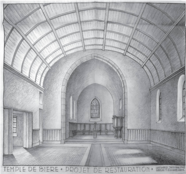
5 Projet de restauration intérieure, Frédéric Gilliard architecte, janvier 1942 (ACV, P Gilliard 9).