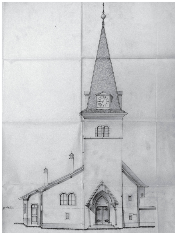
2 Relevé de la façade avant restauration, F. Gilliard architecte, 1942 (ACV, AMH A 28/5b).