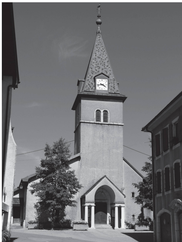
3 Clocher-porche, état actuel (photo G. Curchod, 2015).

de restauration et d'aménagement du temple. La seule étude historique dédiée au bâtiment, rédigée en 1995 par un instituteur local, Henri Burnier, nous permettra d'avoir une vue d'ensemble de son évolution au cours des siècles 10 avant d'étudier en profondeur l'intervention de Frédéric Gilliard. Notons que cette étude doit être considérée avec précaution, car elle n'est pas référencée.