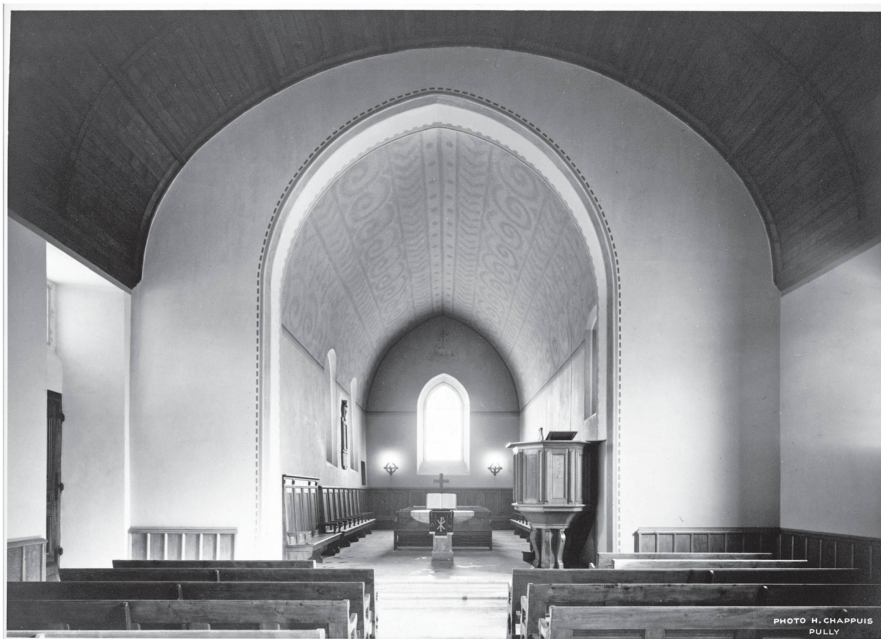
8 Photographie du chœur après restauration, 1943 (© Rémy Gindroz, ACV, AMH A 28/5b)

par contraste ne repose sur aucun fondement archéologique. D'ailleurs, Gilliard n'établit pas de lien entre les sondages effectués par Ernest Correvon et sa manière de procéder qui semble avant tout reposer sur une interprétation très personnelle et artistique. En repeignant intégralement le temple, Gilliard décide de supprimer la frise Art nouveau, car il juge sans doute qu'elle ne s'intègre pas dans son projet de restauration qui cherche à rendre à l'édifice un aspect primitif.