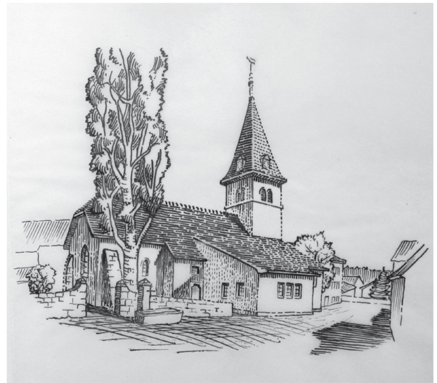
1 Temple de Bière, croquis du projet de restauration, F. Gilliard architecte, 1942 (ACV, P Gilliard 9).

Au sein de cet important corpus, le chantier du temple de Bière constitue un cas remarquable de restauration des années 1940. Dans le contexte de la Seconde Guerre mondiale, près de dix ans après la rédaction de la Charte d'Athènes, l'intervention de Frédéric Gilliard ( fig. 1 )