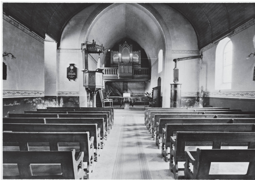
4 Photographie de la nef avant restauration, 1942.