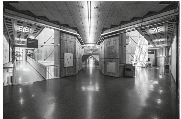
4 Le couloir principal et les « rues secondaires », qui desservent les locaux. Celles-ci sont traitées en diagonales, ce qui génère pour l'œil humain une perception désorientée de l'espace.

L'intérieur est dominé par une circulation horizontale qui s'articule de façon complexe sur de vastes espaces ouverts dont l'expressivité formelle en fait l'esthétique. La prédominance du système de circulation, annoncée par le plan, se matérialise par l'imposante « rue principale », longue de 220 mètres ( fig. 4 ). Répétée à tous les étages, celle-ci permet au visiteur d'appréhender le gigantisme du bâtiment et de le traverser sans interruption. L'imposant couloir du rez-de-chaussée supérieur fait l'objet d'une mise en scène magistrale par les architectes. Ouvrant sur de nombreuses voies diagonales – les « ruelles » secondaires qui desservent les différents locaux rejetés sur les côtés –, il est rythmé par les deux escaliers centraux, à valeur sculpturale forte, les « places ». Tous deux sont façonnés en béton ; les marches étant serties de granit clair. Leur forme différente a pour mission d'orienter le visiteur dans son parcours. L'un d'eux, adoptant l'allure d'une croix, semble suspendu au toit et descend en cascades jusqu'au rez-de-chaussée supérieur alors que l'autre s'enroule en double révolution, sur le modèle de celui de Chambord. Les deux dispositifs, à éclairage zénithal formé par de grands tambours, sont conçus comme d'immenses moyeux d'activation des échanges entre les différents utilisateurs ( fig. 5 ). Deux escaliers secondaires, également éclairés par des verrières et placés à