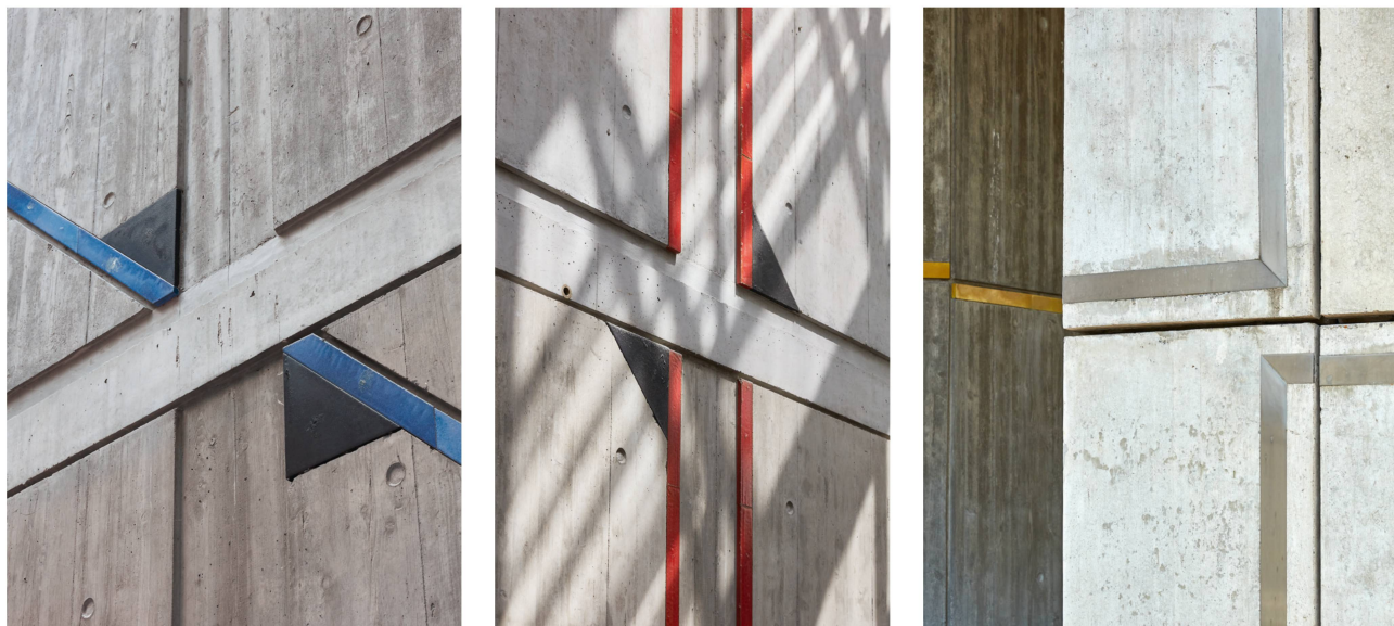
6abc Le dessin des joints négatifs de tailles variables crée un jeu d'ombre et de lumière dynamique que viennent colorer par touches linéaires les bandes de céramique. Les incrustations métalliques, placées sur le pourtour extérieur du bâtiment, animent et dynamisent les surfaces mates du béton.

chacune des extrémités du couloir, près des entrées principales, complètent le dispositif.