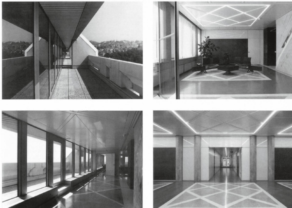
8 Immeuble administratif de la Vaudoise Assurances, incrustations en forme de losanges (PLAREL. Bureau d'architecture et d'aménagement du territoire. Lausanne. Reflet, s.d. [1987], sans pagination).