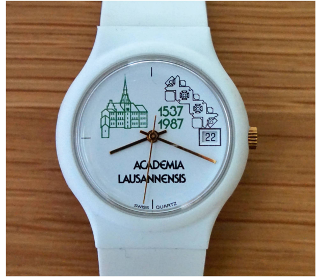
9 Cadran d'une montre éditée lors de l'inauguration-commémoration de 1987 mettant en parallèle l'ancienne Académie de Lausanne et le plan du BFSH2.

La modularisation intérieure de l'édifice, articulée pour former des unités distinctes, les « maisons », ne suffit pas à contenir et canaliser le sentiment de désorientation qui domine.