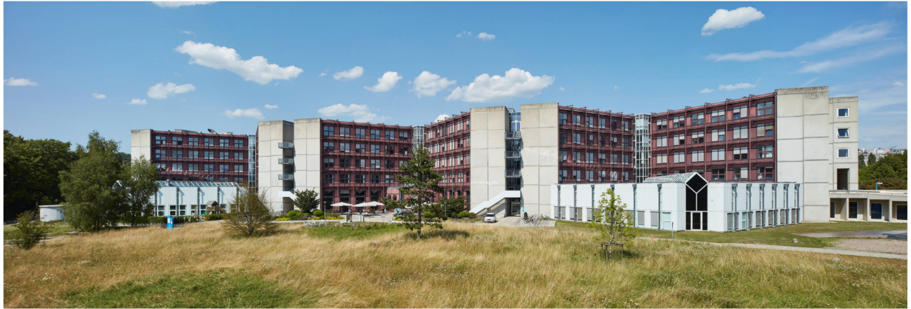
3 L'Anthropole, vu du sud-ouest, déroule ses façades en bordure de parcelle, ménageant l'espace du parc paysager auquel il s'intègre harmonieusement malgré son gigantisme.

L'enveloppe du BFSH2 se compose de murs pignons en panneaux de béton préfabriqués, galonnés de bandeaux d'inox, qui encadrent les douze façades-rideaux devant lesquelles passent des coursives. Ces vastes surfaces vitrées dispensent ainsi un éclairage naturel maximal dans les bureaux et les salles de cours, les espaces de circulation intérieure et la cafétéria du rez-de-chaussée inférieur.