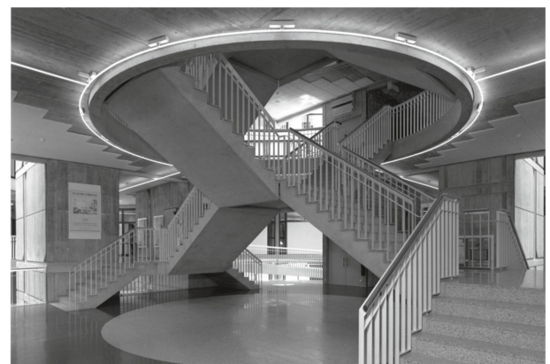
5 Escalier principal sud-est en forme de croix articulée dont la valeur de « carrefour » est signalée par le trait fin des tubes néon d'origine qui dessinent un cercle, repris au sol par l'incrustation en granit clair (photo Henri Germond, vers 1987).