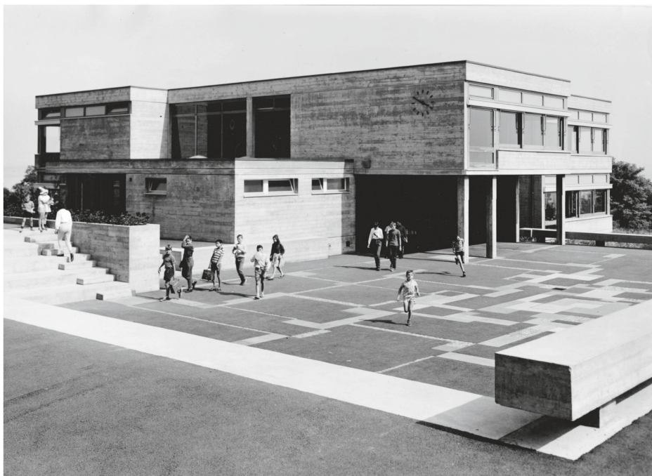
7 Collège des Charmettes à Neuchâtel. Jeu d'incrustations conçu par André Siron et escaliers en forme de gradins qui structurent le vaste espace du préau qui se glisse sous le bâtiment (photo Françoise Rapin, années 1960).

Ce dispositif développe les expériences précédentes menées par Bevilacqua aussi bien que Dumas. Au collège des Charmettes à Neuchâtel (1961-1964), Bevilacqua avait collaboré avec le peintre neuchâtelois André Siron (*1926) pour la conception d'une composition de pierres et de dalles – des incrustations – prise dans l'asphalte du préau de sorte à animer cet espace ouvert, situé au centre de la composition architecturale ( fig. 7 ).