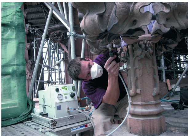
3 Travaux de conservation sur la flèche de la cathédrale

différentes fonctions du monument : activité culturelle, activité touristique, intérêt architectural et archéologique.