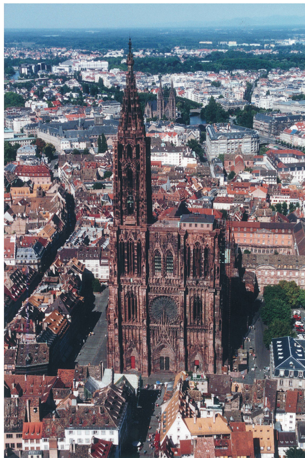
1 Cathédrale de Strasbourg (Photo Fondation de l'Œuvre Notre-Dame).

Les relations entre l'État et la Fondation ont été longtemps fluctuantes. Les travaux pris en charge par l'État et par la Fondation de l'Œuvre Notre-Dame étaient conduits par deux architectes, un pour le compte de l'État et un pour la Fondation. En 1999, une convention-cadre instaurant une maîtrise d'œuvre unique sur la cathédrale est établie entre l'État et l'Œuvre Notre-Dame. Elle précise leur collaboration pour l'entretien et la restauration de la cathédrale. À partir de là, un seul architecte est désigné d'un commun accord entre les deux partenaires. Les projets de travaux sont validés par la Direction régionale des affaires culturelles, sous l'autorité de l'Architecte en Chef des Monuments Historiques et Architecte de l'Œuvre Notre-Dame. Ils