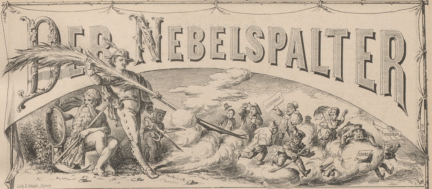
Lith. G. Knüsel, Zürich.