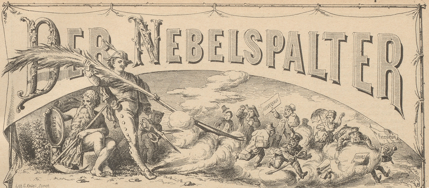
Lith. G. Krüssli, Zürich.