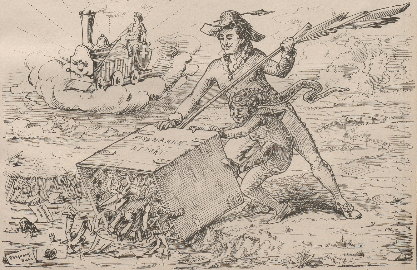
folgt in neue Räume untergebracht werden. Der „Nebelspalter“, der sich auf Ziehen versteht, macht hiefür obigen, gewiß zeitgemäßen, Vorschlag!