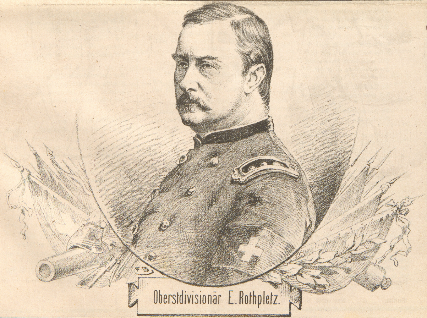
Oberstdivisionär E. Rothpletz.

Alle Postämter und Buchhandlungen nehmen Bestellungen entgegen; franko für die Schweiz: für 6 Monate Fr. 5, für 12 Monate Fr. 10; für das übrige Europa, für Egypten und die Vereinigten Staaten Nordamerikas per 6 Monate Fr. 7, für 12 Monate Fr. 13. 50; für Südamerika, Asien und Australien per 6 Monate Fr. 12, per 12 Monate Fr. 22. Einzelne Nummern 25 Cts.