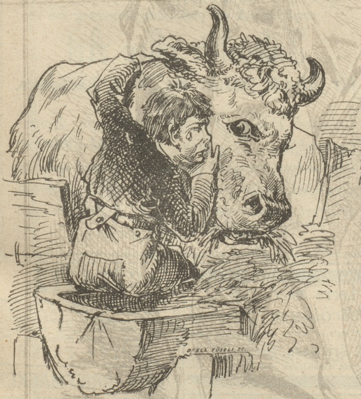
„Oh Lobe, hecht, jes häm'r fen Vater meh!“

In der Gemeinde B. lebte ein Vater mit seinem Sohne und beide liebten sich, wie sich Vater und Sohn nur lieben können. Friedlich und genüßlich bestellten sie mit ihrer Kuh, einem frommen und milchreichen Thier, ihr kleines Gut, das sie alle drei reichlich ernährte. Aber des Lebens ungetrübte Freude wird keinem Sterblichen zu Theil; der gute Vater erkrankte plötzlich und starb nach wenigen Tagen. Unendlich war der Schmerz des guten Sohnes, heiße Thränen rollten über seine Wangen und überwältigt von dem namenlosen Weh des Verlassenseins, ging er in den Stall, umhastete den guten „Mled“ und sprach mit klagender Stimme: