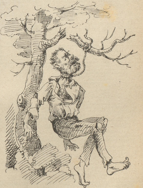
Illustrationen zu deutschen Klassikern.

Drum prüfe, wer sich ewig bindet! (F. Schiller, Glocke.)