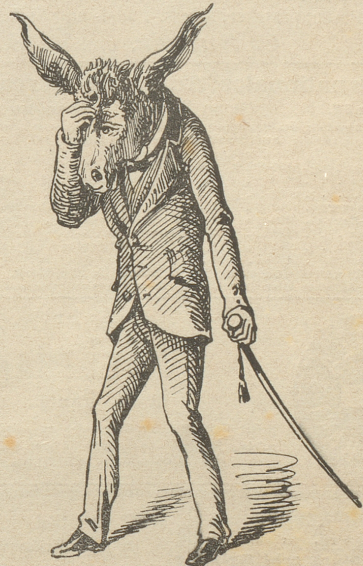
Eine dumme Behauptung.