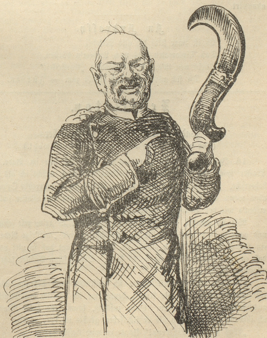
Nach dem Kongress.

Meine Herren! Die orientalische Frage ist, seit ich sie zur Hand genommen, leicht zu behandeln; man klappt sie einfach zu,