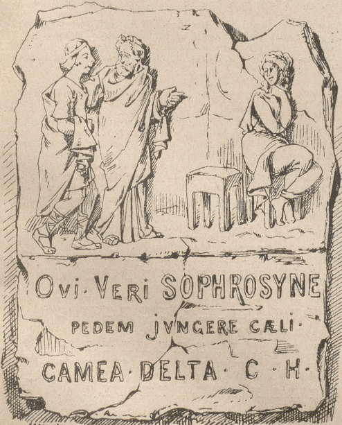
(Auflösung folgt in nächster Nummer)