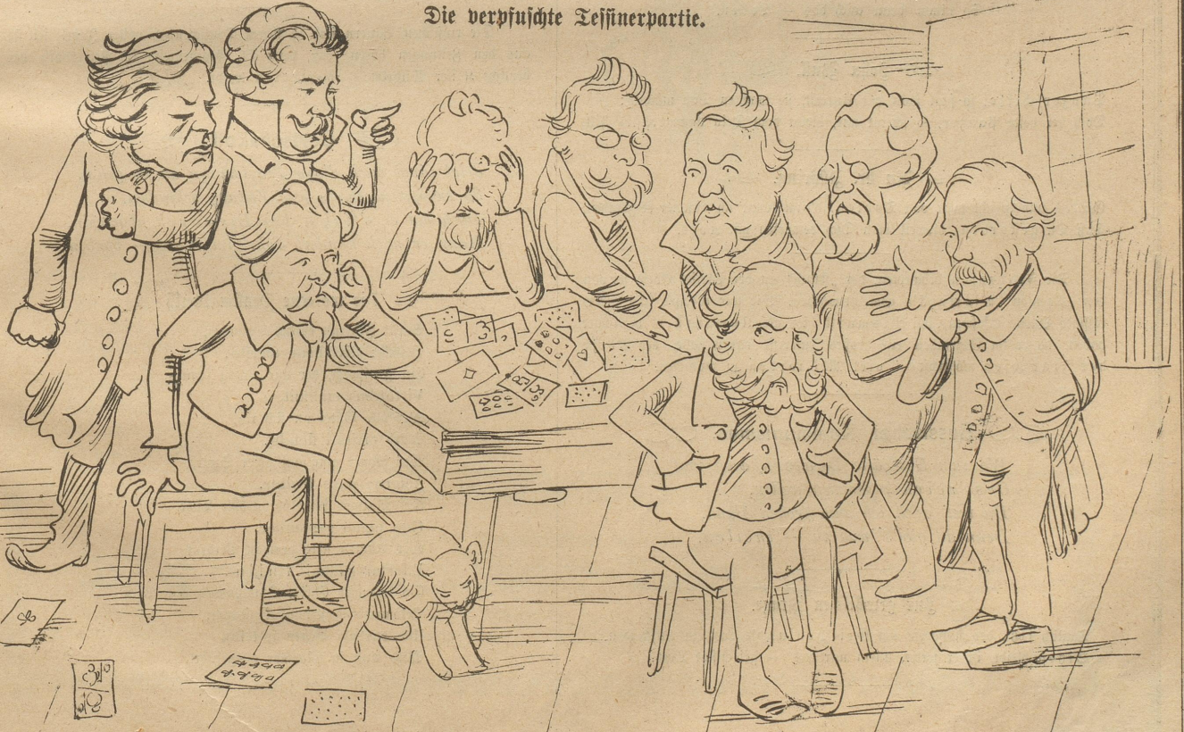
Die verpfuschte Tessinerpartie.

„Hämäris nüd g seit!? Sg'scheht Gu recht, jez hämer all' mitenand verlore!“