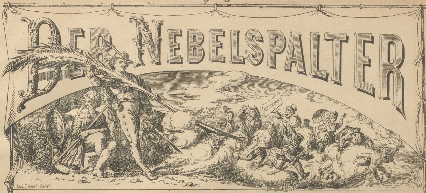
Lith. G. Knusli, Zürich.