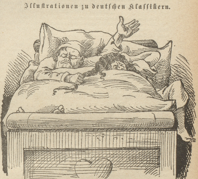
Illustrationen zu deutschen Klassikern.

„Ja, selbst im Traum der stillen Nächte, fand ich mich keuchend im Gefechte!“ (Schiller: Der Kampf mit dem Drachen.)