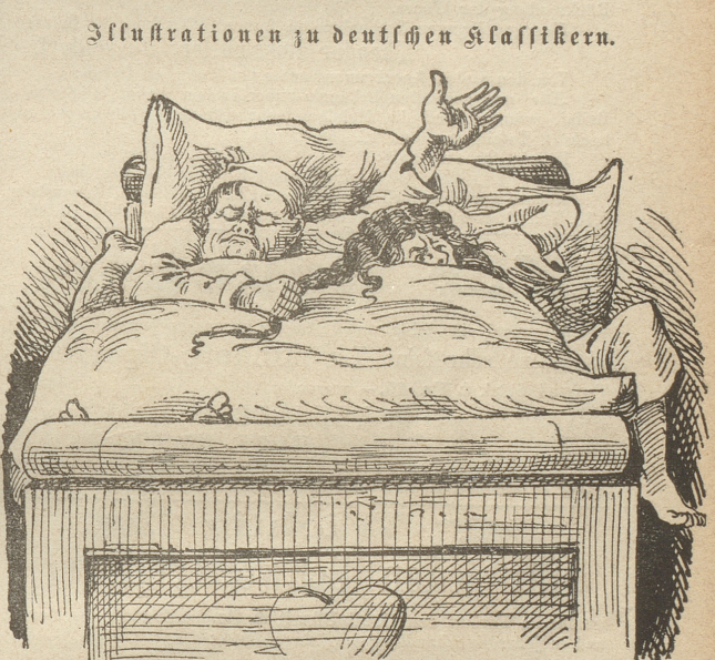
Illustrationen zu deutschen Klassikern.

Käsewurst ein pikanter, fetter, haltbarer Käse, versendet gegen Nachnahme franco Schweiz einschliesslich Verpack.: 7 Stück für 4 1/2 Reichsmark. 14 „ „ 8 „ „ 20 „ „ 10 „ „ A. Düsing, Görlitz.