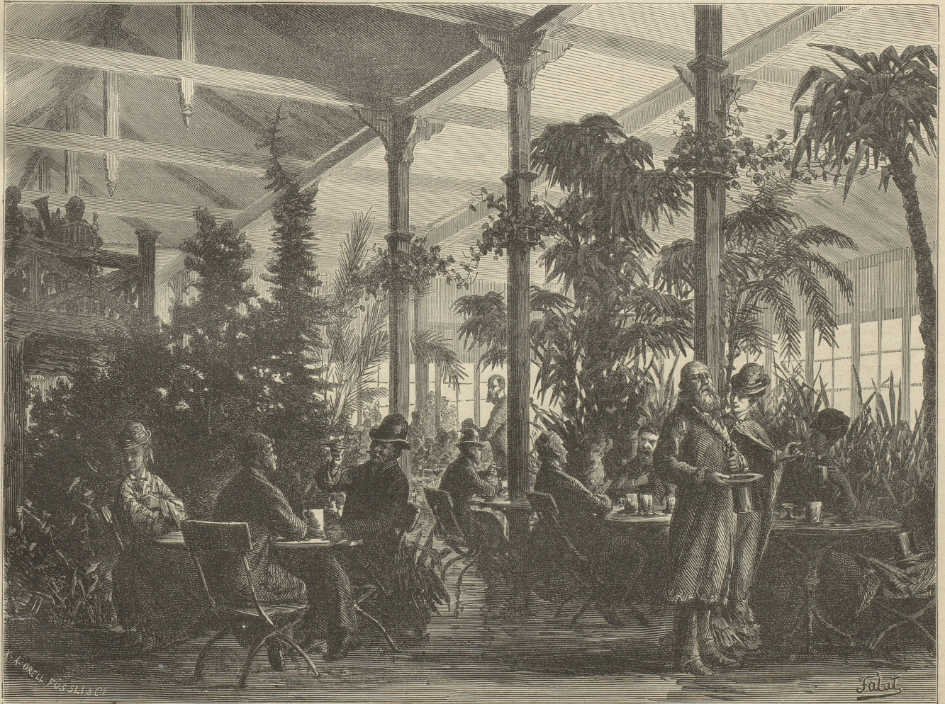
Wintergarten in der Tonhalle in Zürich. Originalzeichnung von J. FALAT.